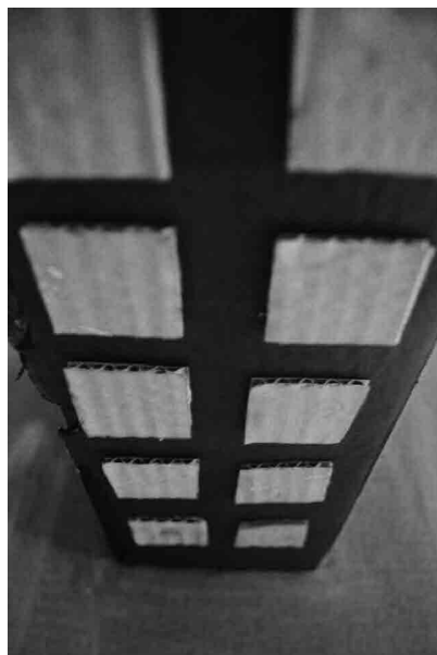
Figura 6 · Fotografia capturada pelos alunos — Chapecó, 2016. Fonte: própria.