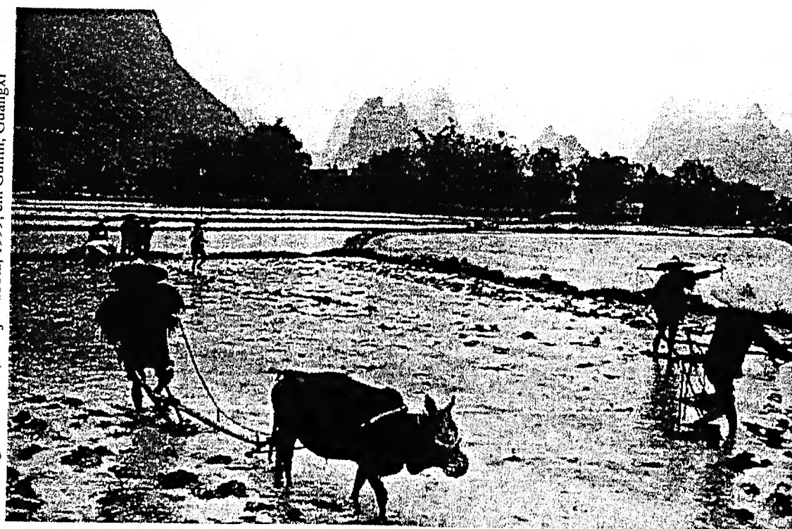
1999, em Guilin, Guangxi