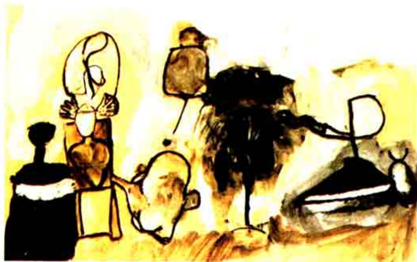
[Fig. 4] – Viva o Ding Dong, 1961. óleo s/papel, 240x350 mm, col. da Artista.

Pequenos desenhos a óleo sobre papel documentam expressivamente esta fase lúdica da pintora, sentada a trabalhar numa mesa, como quando era criança. Tratam-se