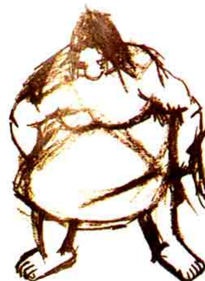
[Fig. 1] Desenho no Sketchbook, 1953, lápis s/papel, escala das folhas, 210x150 mm, col. da Artista.

... O lápis é o mais, [hummm] o mais difícil, é o mais puro, e é o mais austero. E é o que dá talvez mais precisão do que qualquer outra coisa, porque não se pode estar a folgar nem para um lado nem para outro. Tem que se tentar fazer tal e qual. Portanto o lápis é a base de tudo. O lápis - lápis, não é verdade? O carvão é outra coisa. O carvão não é nada preciso. O carvão é uma espécie de plasticina, nunca ficam as coisas no seu lugar. Esborrata tudo, borra tudo .... 12