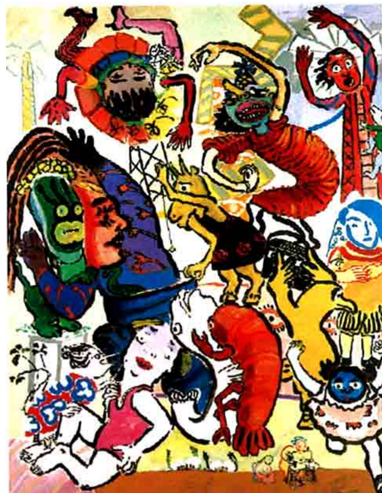
[Fig. 7] – The Vivien Girls as Windmills , 1984, acrílico s/tela, 242x179 cm, col. FCG/CAMJAP, Lisboa, nº inv. 86P589.

Estas importantes questões foram explicadas por Paula Rego: