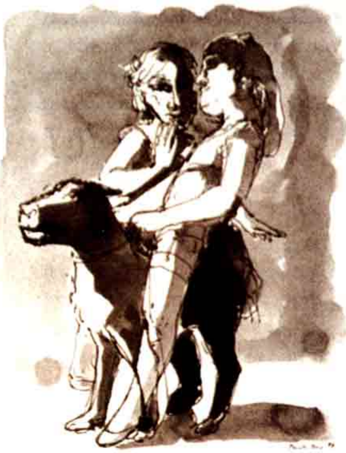
[Fig. 8] – Study for "Two Girls and Dog", 1987, caneta e aguada, 3020x3620 mm, col. da Artista.

nho, noutra à esquerda, uma praia que muda para adro enfeitado, um poço que aparece e desaparece. A roda da dança, faz-se e desfaz-se. Os grupos de pessoas que dançam vai mudando também de desenho para desenho. Uma varina dança sozinha, com o lenço amarrado à cabeça, e uma menina de chapéu, passa solitária.