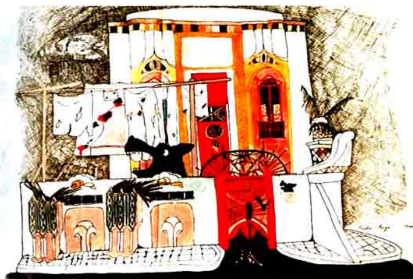
[Fig. 2] Moradia no Alto do Estoril, 1970, tinta da china e acrílico s/papel, col. da Artista.

Marcando já uma actividade profissional, Paula Rego utiliza o desenho sob diferentes perspectivas. Surge uma tipologia de desenho de carácter surrealista 19 , (rótulo que apenas usamos para facilitar uma classificação), mas que na verdade é sobretudo libertador, como se observa nos desenhos Quarto dos Deveres , O Sonho de Vic ou o Passeio em Cascais .