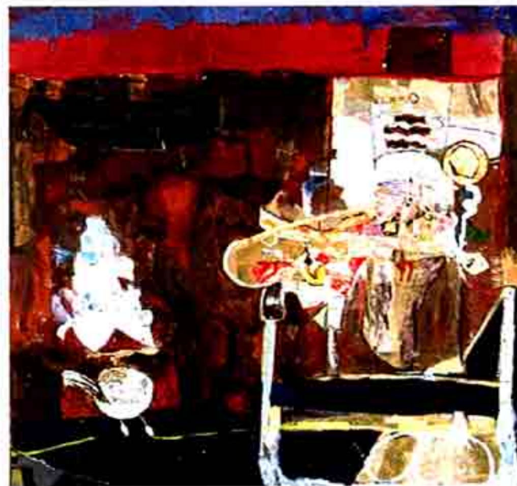
[Fig. 3] Sr. Vicente e sua esposa, 1961, óleo e colagem s/tela, 905x905 mm, col. FCG/CAMJAP, Lisboa, nº inv. 83P448.

Nestes casos, como em muitas das suas gravuras, a figuração é traçada com muita clareza, em traço afirmativo, numa só linha, sem hesitações nem ambiguidades, riscando com pequenos traços finos as texturas que pretende apontar, e utilizando aguadas cinzas para as zonas de sombra. Por vezes a cor intervém como é o caso do desenho Moradia no Alto do Estoril [Fig. 2]. Os temas e a interacção dos personagens em cena constituem a caracterização surreal pela estranheza e fantástico das situações, como se a pintora representasse os seus pesadelos e os dos outros.