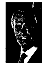
Aníbal Cavaco Silva