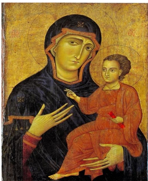
Figura 1 - Madonna and Child (Berlinghiero, circa 1230). Na pintura, percebemos que a criança mais parece um pequeno homem adulto, com traços fortes.

Naturalmente, esta falta de interesse não implica falta de afeição pelas crianças, senão a ausência de uma consciência de particularidade da criança.