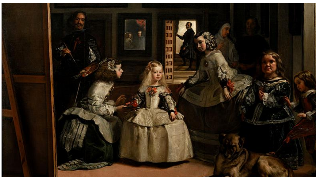
Figura 2 - "As Meninas" (Valázquez, 1656). No século XVII, como já dito, crianças começam a receber uma feição mais distinta das dos adultos, e a serem elementos centrais de pinturas. Contudo, a menina retratada, com aproximadamente 5 anos, possui a mesma forma de vestir dos adultos.

Aos poucos a criança vai começando a ser vista como um indivíduo único, e isso traduziu-se em pequenos detalhes. Um grande marco, segundo Áries, foi a partir do século XX, mais precisamente após a Iª Guerra Mundial quando se tornou habitual para classes altas distinguir suas filhas através das vestimentas. Até então, a maneira de vestir a criança do sexo feminino era praticamente igual ao adulto, sendo possível perceber em quadros da época.