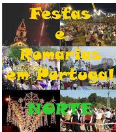
Festas e Romarias em Portugal – Norte (Trás-os-Montes e Alto Douro)

A Festa dos Caretos, no Domingo de Carnaval, em Podence (Macedo de Cavaleiros, é uma espécie de retoma da Festa dos Rapazes (que tem lugar por alturas do Natal), mas desta vez ligada aos rituais carnavalescos que assinalam o início dos constrangimentos da Quaresma, o fim do ciclo do Inverno e marcam o renascimento que a aproximação da Primavera representa para quem tira da terra o seu sustento.