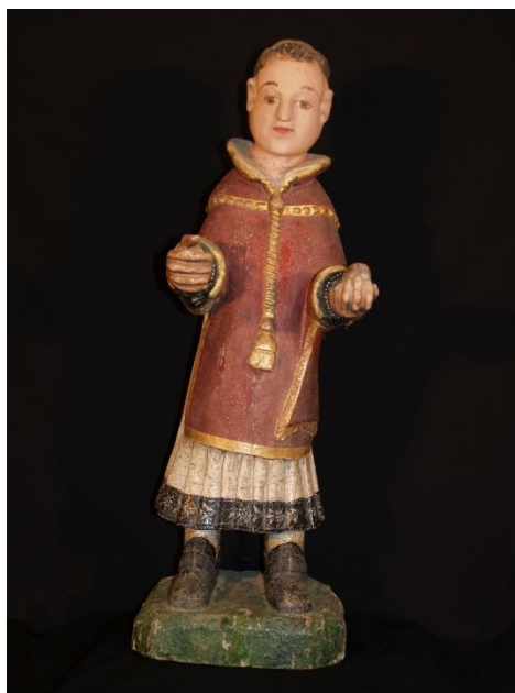
Imagem de Santo Estevão – Igreja NS da Purificação – Podence.

Santo Estêvão goza de bastante popularidade em países europeus, como Espanha, França, Itália e Portugal. No Brasil, existem, além de diversas capelas ou casas de formação, outras sete paróquias, dedicadas a Santo Estêvão. Entre os espíritas, o livro Paulo e Estêvão, de psicografia de Francisco Cândido Xavier e atribuído ao espírito Emmanuel, é considerado pela Federação Espírita Brasileira um dos dez maiores livros espíritas do século XX, narrando passagens da vida de Santo Estêvão.” 26