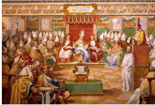
Concílio de Niceia

Este foi o primeiro concílio geral na história da Igreja convocado por Constantino I. No Concílio de Niceia, (a Igreja deu seu primeiro grande passo para definir a doutrina revelada, de forma mais precisa, em resposta a um desafio de uma teologia herética.)