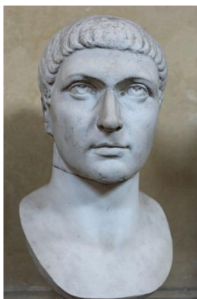
Imperador Romano "Constantino" (272/337)