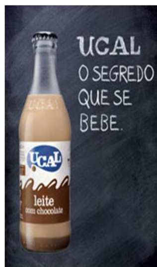
Figura 9: Um dos correspondentes portugueses. In: < http://www.parmalat.pt/advertising.php?idadvert=8 > (Web. 17/10/2010).

Ao longo do short story encontra-se este tipo de referências a marcas ou empresas desconhecidas na realidade portuguesa. É o que se observa nos seguintes exemplos: Elmer's (“Recitativo”:162) a marca de cola bastante conhecida nos Estados Unidos; Lady Esther (“Recitativo”:163) uma marca de cosméticos conhecida devido à acessibilidade, em termos de preços dos seus produtos e cuja sede se localiza em Chicago; Greyhound (“Recitativo”:164) referindo-se a uma empresa de autocarros; A&P (“Recitativo”:166) que constitui uma cadeia de supermercados com lojas nos estados de Nova Jérnia, Nova Iorque e Massachusetts; Queen Elizabeth Roses (“Recitativo”: 166), conhecidas em Portugal como Rosas Rainha Elizabeth ou simplesmente por rosas cor-de-rosa; Klondike ice cream bars (“Recitativo”:166) uma marca de gelados fundada no início do século XX; Today show (“Recitativo”:170) um programa televisivo que transmite as notícias matinais e que foi para o ar em 1952; Tab (“Recitativo”:171) um refrigerante produzido pela Coca-Cola Company a