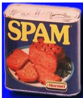
Figura 4 e 5: Spam, o produto e o recipiente dos anos 50. In: < http://www.boundlessline.org/2008/05/budget-crunch-1.html > e < http://whatscookingamerica.net/History/Spam.htm > respectivamente (Web. 17/10/2010).

Para o termo Salisbury steak (“Recitativo”: 160) seguiu-se o mesmo método, embora por razões diferentes. Estes termos que referem produtos alimentares surgem num contexto de recusa de Roberta de os consumir. Por isso mesmo crê-se que a tradução portuguesa implementada e aceite para este prato, “Bife Salisbury” não descreveria exactamente o tipo de refeição que seria servida num orfanato nos anos 50, assim como não reforçava o facto de uma das personagens se recusar a consumi-lo. A solução encontrada foi “a mistela de carne com molho a que chamavam bife Salisbury” [minha tradução], explicitando o tipo de prato de que se trata e dando ao leitor uma imagem que justifica a recusa de Roberta a comer este prato.