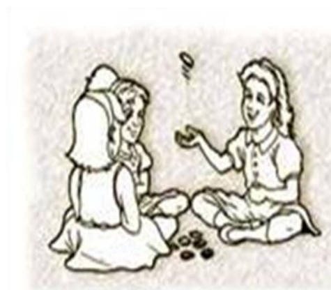
Figura 3: Jogo tradicional português. In: < http://terrenho.blogspot.com/2009/04/jogo-das-pedrinhas.html > (Web. 17/10/2010)

As designações de produtos alimentares também se revelaram algo difíceis de traduzir, tendo-se, neste caso, optado por seguir a norma anteriormente referida como tradução em adequação, recorrendo ao mesmo tempo ao universal ou estratégia tradutória da explicitação.