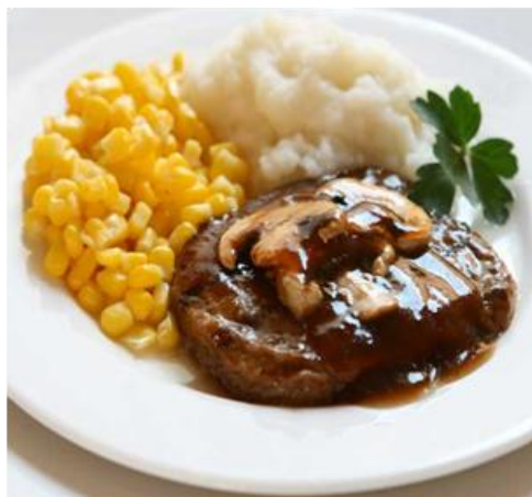
Figura 6: Um prato de Bife Salisbury. In: < http://www.nationalpost.com/life/Week+Salisbury+steak+three+times+keeps+doctor+away/3014077/story.html > (Web. 17/10/2010).

Para o termo Salisbury steak (“Recitativo”: 160) seguiu-se o mesmo método, embora por razões diferentes. Estes termos que referem produtos alimentares surgem num contexto de recusa de Roberta de os consumir. Por isso mesmo crê-se que a tradução portuguesa implementada e aceite para este prato, “Bife Salisbury” não descreveria exactamente o tipo de refeição que seria servida num orfanato nos anos 50, assim como não reforçava o facto de uma das personagens se recusar a consumi-lo. A solução encontrada foi “a mistela de carne com molho a que chamavam bife Salisbury” [minha tradução], explicitando o tipo de prato de que se trata e dando ao leitor uma imagem que justifica a recusa de Roberta a comer este prato.