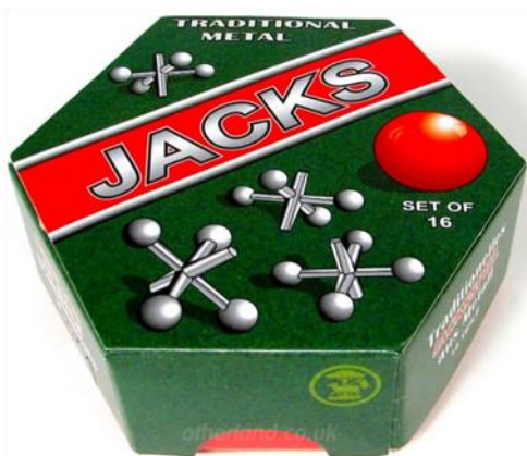
Figura 2: Jogo comercializado nos EUA. In: < http://www.otherlandtoys.co.uk/metal-jacks-game-p-2188.html > (Web. 17/10/2010)

Apesar de ser um jogo muito popular na realidade cultural norte-americana, o mesmo não acontece em Portugal, não se encontrando o referido jogo à venda no nosso país. Existe, contudo um jogo tradicional português que se joga basicamente da mesma maneira que o Jacks , constituindo a única diferença as peças utilizadas para jogá-lo. Na realidade portuguesa, este jogo joga-se com pequenas pedras, e designa-se jogo das pedrinhas. Deste modo, e neste caso, aplicou-se o conceito de tradução em aceitabilidade ao traduzir Jacks por jogo das pedrinhas.