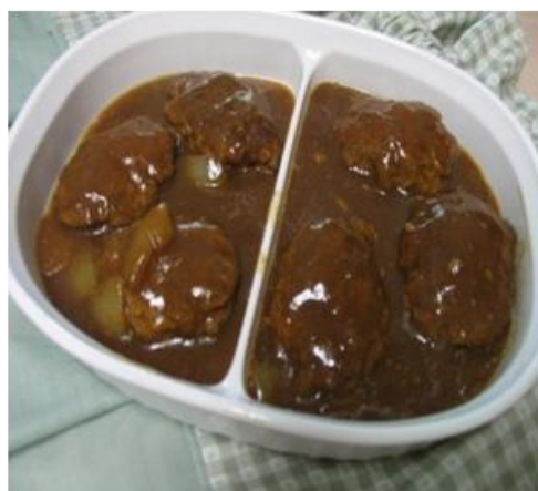
Figura 7: Aspecto do mesmo prato, no qual se baseia a tradução. In: < http://www.mommyskitchen.net/2008/08/salisbury-steak-crock-pot-style.html > (Web. 17/10/2010).

Também o termo Yoo-Hoo (“Recitativo”: 160) se encontra na mesma situação dos anteriores. Apesar de ser um produto e uma marca regista norte-americana, a sua comercialização cinge-se apenas à América do Norte, não existindo no contexto português.