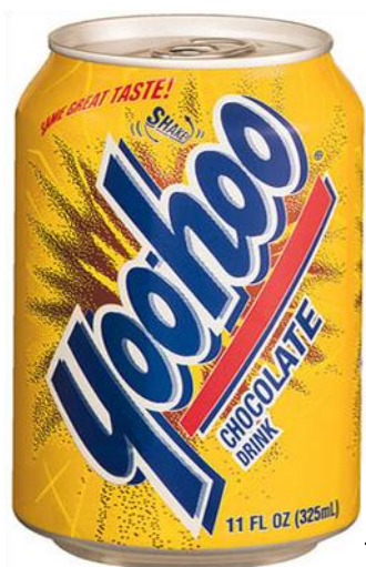
Figura 8: Uma lata de Yoo-Hoo.

Este termo foi traduzido por “uma lata de leite com chocolate Yoo-Hoo ” [minha tradução]. Mas porquê manter o nome do produto inalterado se existe um correspondente na realidade cultural portuguesa? A resposta é simples: um texto deve ser coeso e coerente, logo, apesar de existir um correspondente em português, o compromisso assumido no início de fazer uma tradução tendencialmente em adequação deve ser mantido por todo o texto de chegada.