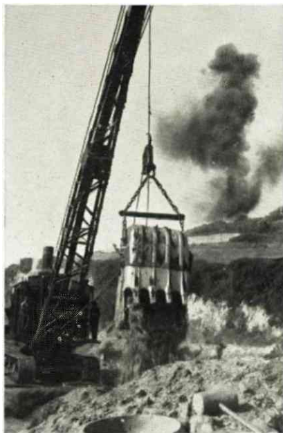
Escavadora de Balde (Dragline)