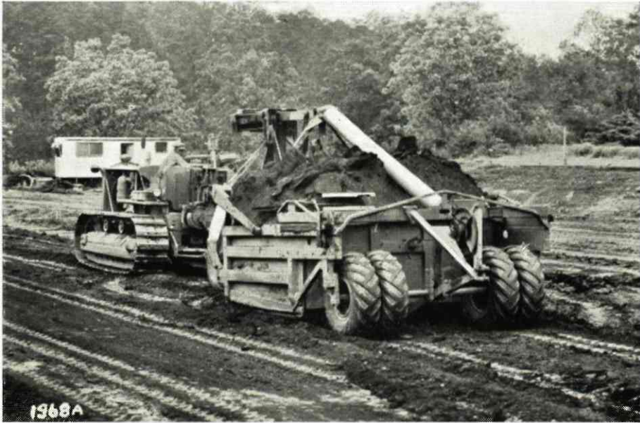
Tractor e Scraper