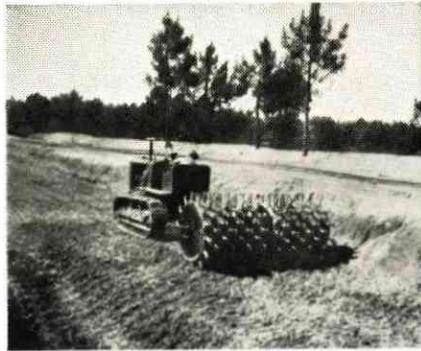
Cilindro compressor Sheep's Foot (Pé de Carneiro)