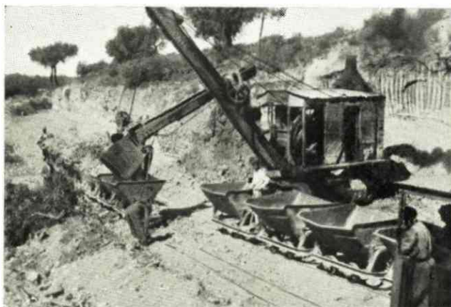
Escavadora de Colher (Shovel) e material de transporte