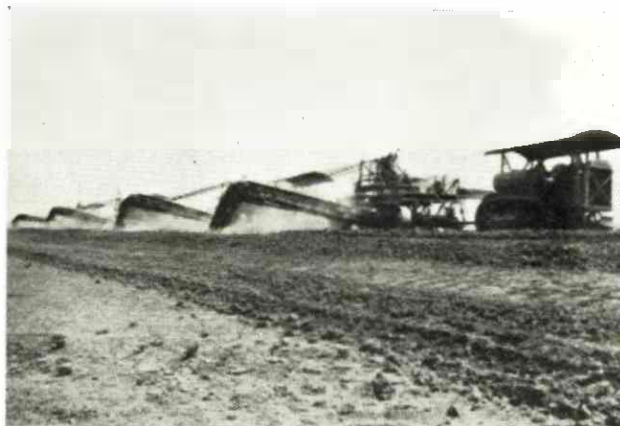
Uma «esquadra» de Elevating Graders cons- truindo valados de de- fesa contra cheias nos terrenos marginais do Guadalquivir