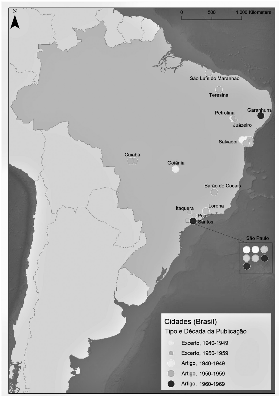
Figura 1. As cidades estudadas por Aroldo de Azevedo.