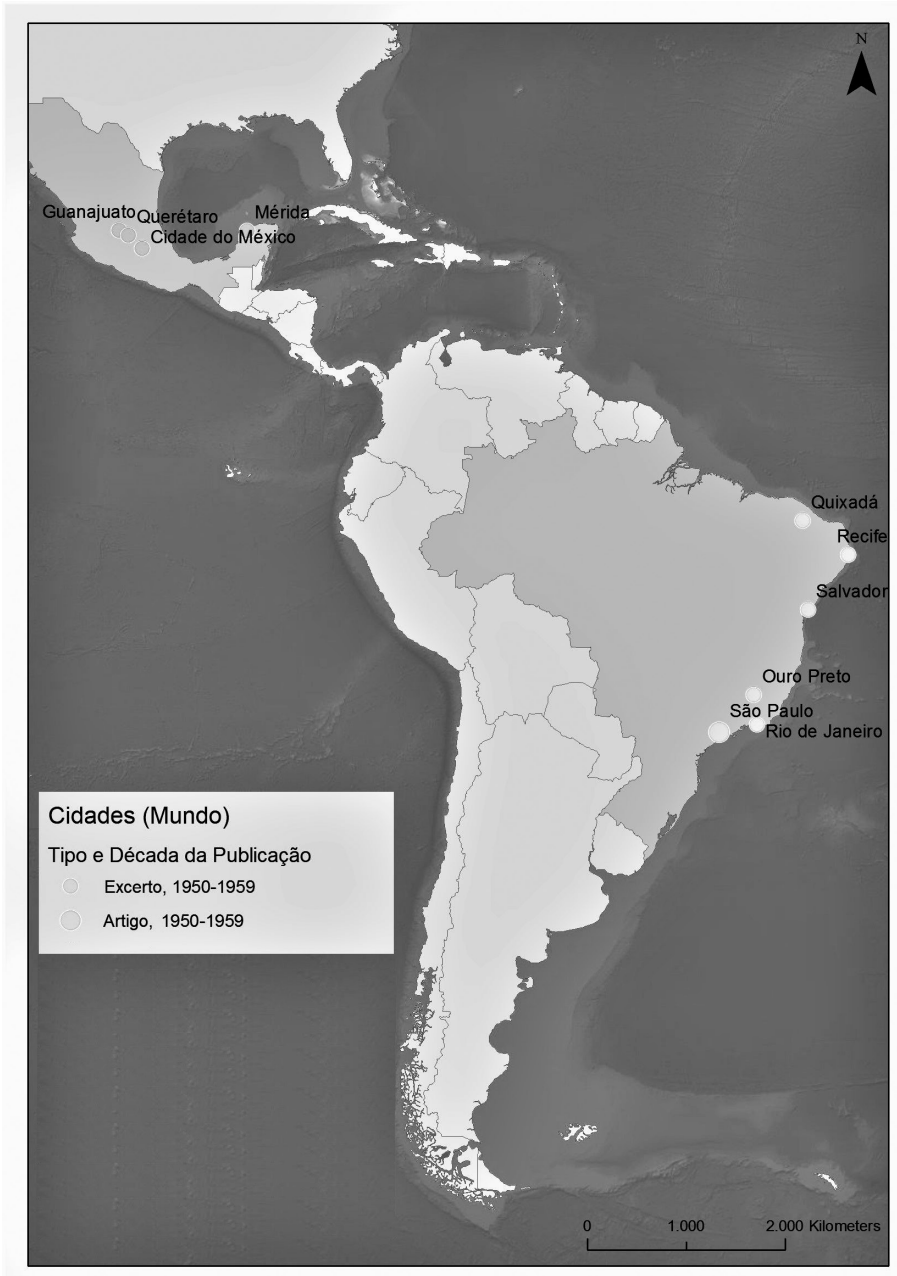
Figura 3. As cidades americanas estudadas por Orlando Ribeiro.