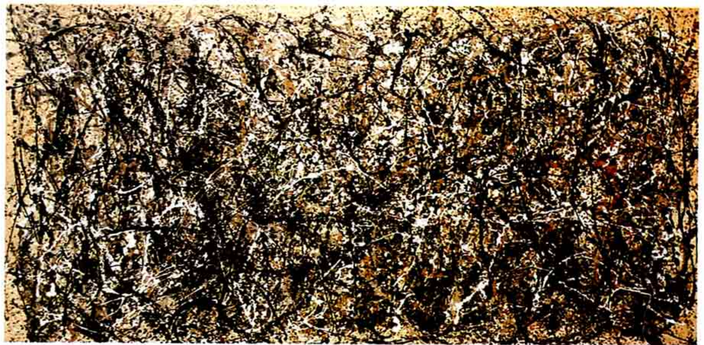
Jackson Pollock , pintura "Um", dimensão 260 x 532 cm, 1950

Um acto pictórico evoca a primordialidade fundadora da pintura, e instaura um novo paradigma estético, este entendimento da arquitectura pictórico-historicista circunscreve e cataloga as "transgressões" aos princípios modernistas. Ironicamente poderemos considerar que era esteticamente correcto ser-se Expressionista Abstracto no pós-guerra.