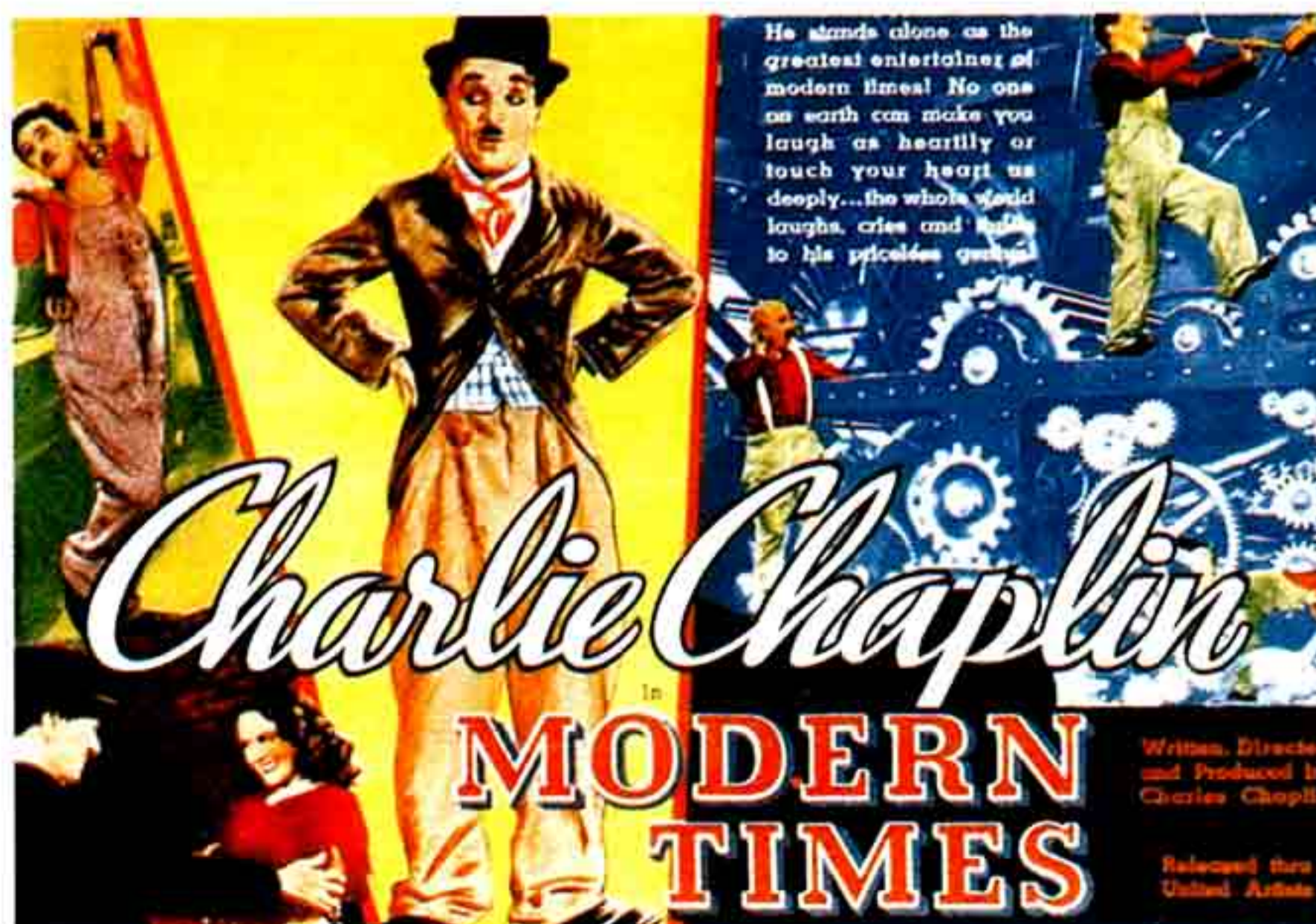
Cartaz do filme "Tempos Modernos" de Charlie Chaplin , que caricatura a mecanização da vida.

Perante este cenário de uma economia pós-humana , significando que o ser humano foi reduzido à condição de não ser, podemos reconhecer facilmente as coroas de sacrifício, pela cultura institucional que gere laboratorialmente estes fenómenos com o apoio dos sociólogos que estudam formas de minimizar o impacto desses problemas incómodos, sendo a repressão exercida cirurgicamente e sempre para manter uma ordem, Furio Colombo diria, "zonas de vietnamização", continua a ser politicamente correcto manter o alibi de um contexto de competição internacional à escala mundial, como se fosse possível fazer saltar sociedades cujo estágio de desenvolvimento se situa na pré-industrialização para a pós-industrialização, fazendo crer que esta transição será rápida e indolor