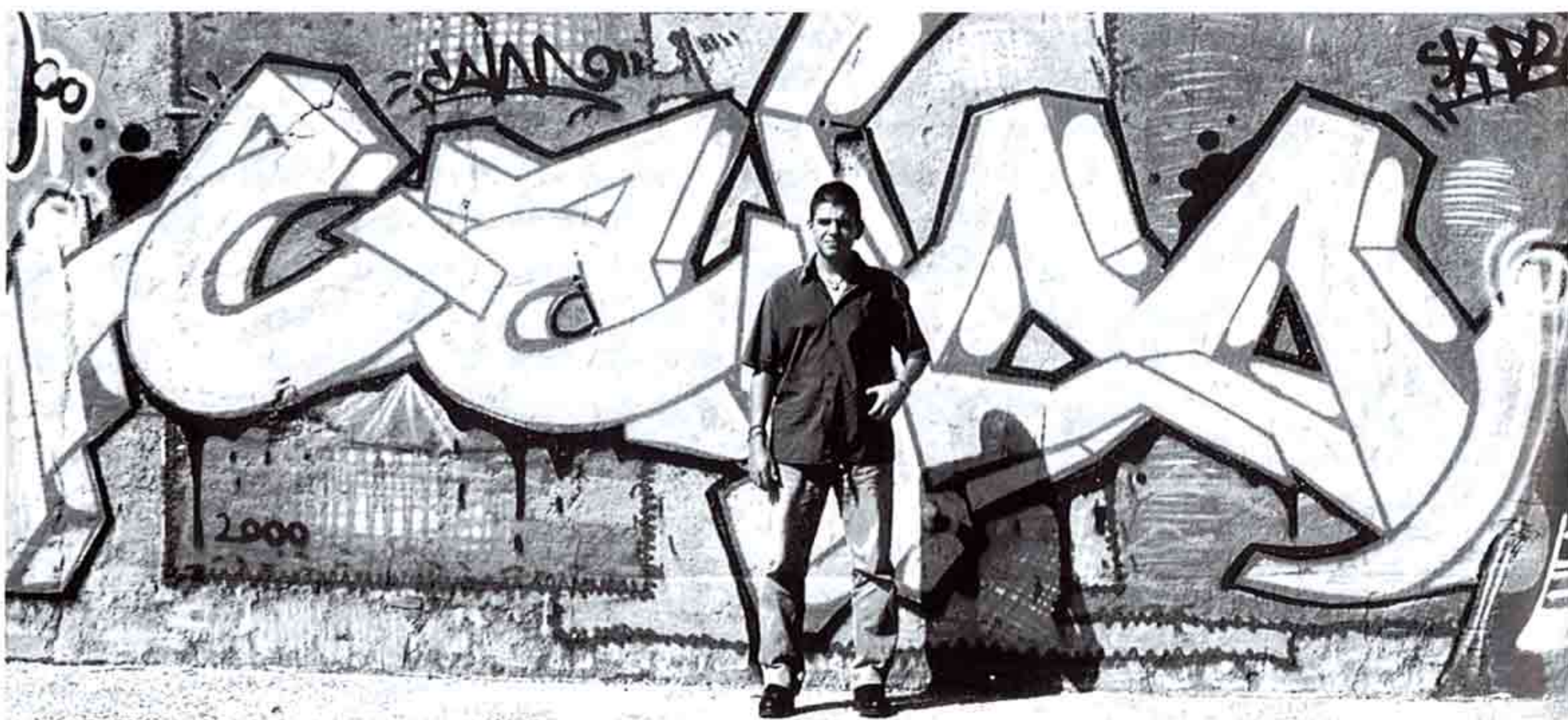
Graffiti de grande dimensão, com "Tag", bem visível Lisboa, zona de Lisboa