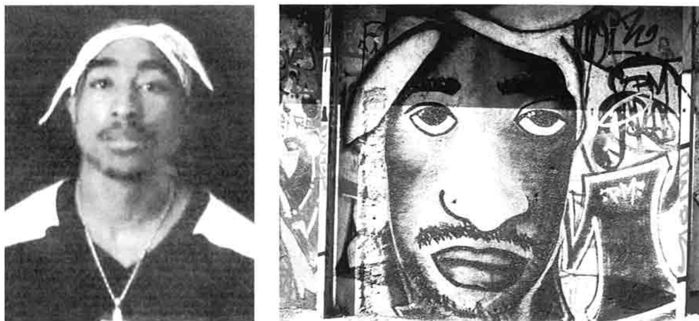
Retrato de Tupac Shakur e Graffiti realizado em Lisboa, área de Belém

A lenda de Tupac Shakur, nascido em 1971, em Brookly, Nova Iorque, e assassinado em 1996, é transmitida oralmente por todo o mundo, é o paradigma do sucesso e triunfo mediático atingidos por Shakur, que se inicia como dancer do grupo rap – Digital Underground, passando posteriormente para o rock onde atinge o estrelato, movimentando milhões de dólares. Na indústria discográfica será considerada como obra prima o seu álbum " All eyes on me ", com forte influência Hip Hop que vendeu 6 milhões de cópias.