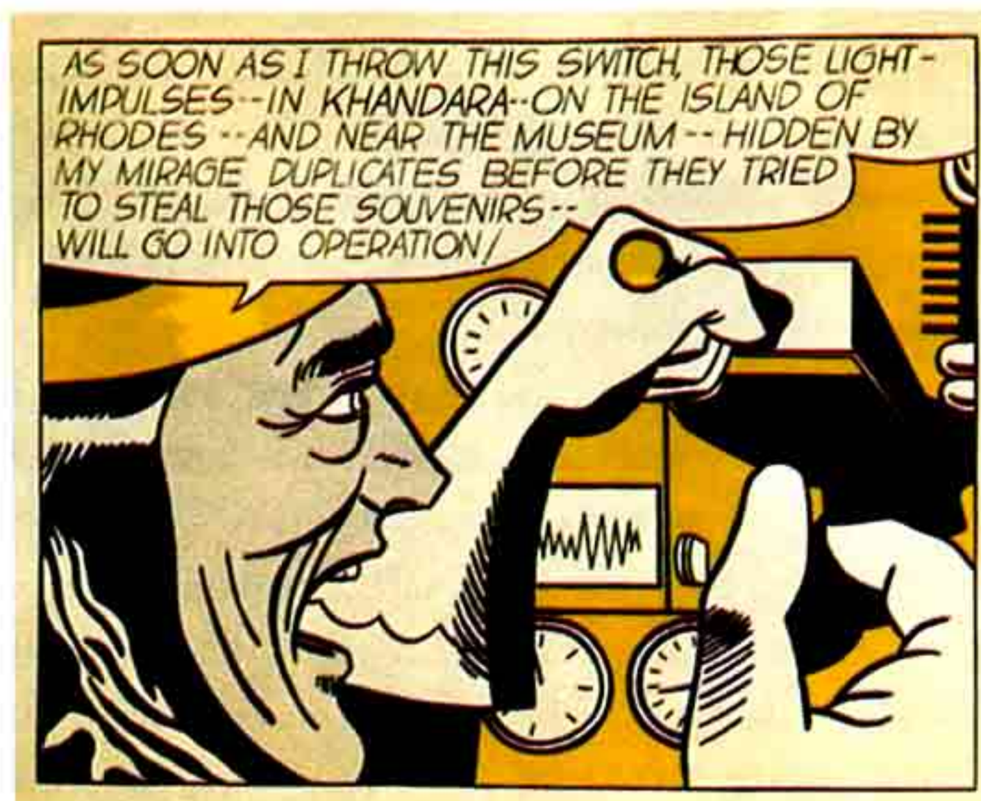
Roy Lichtenstein, pintura, "Cientista Louco", dimensões 127x151 cm

Viviane Forrester, bombasticamente refere-se à globalização e à economia ultraliberal, desta maneira: