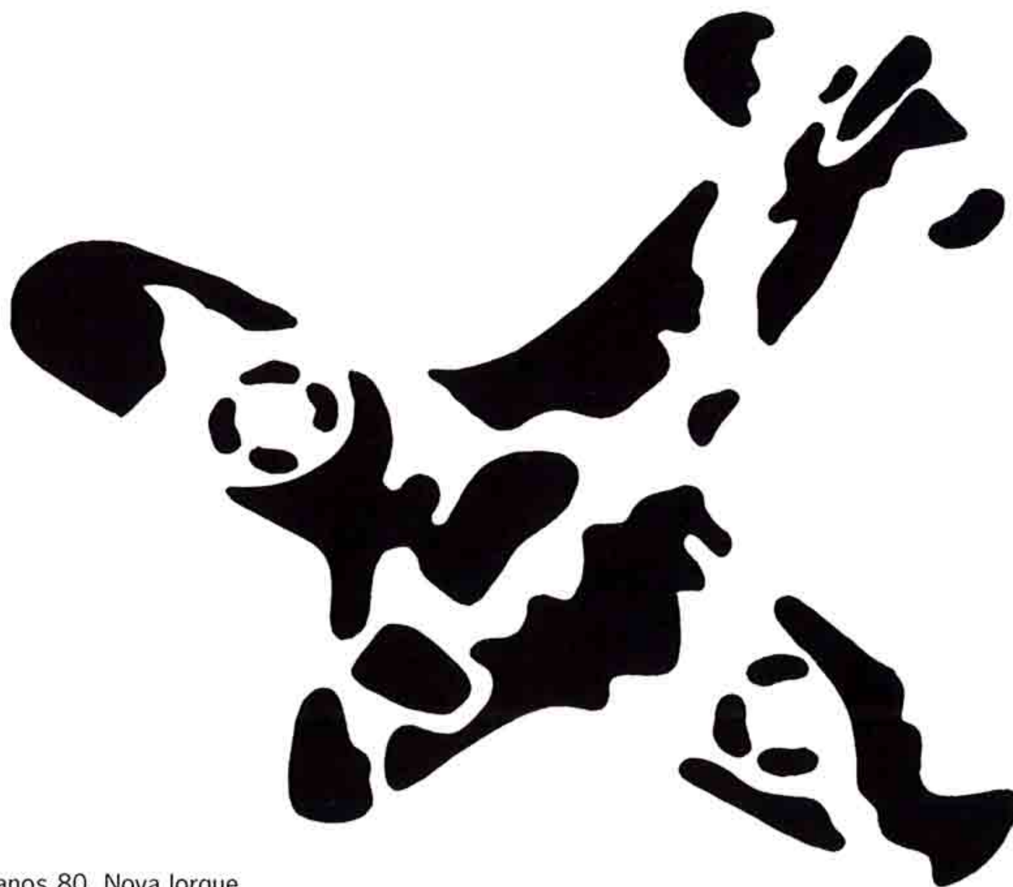
Graffiti de Richard Hambleton , anos 80, Nova Iorque

A conflitualidade entre cultura dominante e cultura dominada, de rua, esbate-se na integração e redução a mercadoria das actividades que caracterizam a hibridade do movimento Hip Hop , adiando medidas estruturantes, projectos faseados para uma real integração no tecido cultural de acolhimento dessas minorias étnicas descaracterizadas, até porque a mundialização inevitavelmente nivelará as culturas e consequentemente as singularidades atribuídas às identidades culturais genuínas tenderão a miscigenar-se. Na óptica oficial já foi reconhecido que a situação se torna insustentável e que é economicamente mais rentável e viável integrar em vez de recuperar.