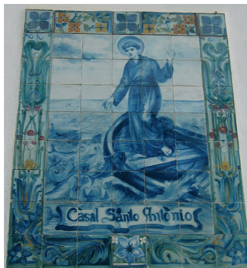
Figura 4 – Painel Casal Santo António, Estoril.

O painel representa Santo António em pé numa barcaça pregando aos peixes. A postura, a expressão serena do rosto e a situação periclitante, com as ondas e o cardume de peixes a baterem no costado, conferem dinamismo e expressividade à cena. Sendo realçada pela qualidade do desenho e na utilização dos tons de azul. A cercadura é em tons polícromos de flores e folhas estilizadas. Este painel de carácter religioso é incomum, por se distanciar da formalidade recorrente neste tipo de painéis (Fevereiro, 2011, p.536).