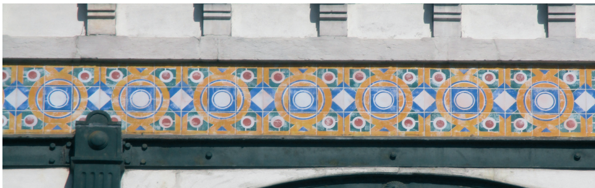
Figura 6 – Faixa azulejar no edifício Armazéns Casa do Povo de Alcântara .

faixas com um painel. Neste a figura humana central é emoldurada por flores abstratas e outras estilizações ao gosto Arte Nova (Fevereiro, 2011, p.558-561).