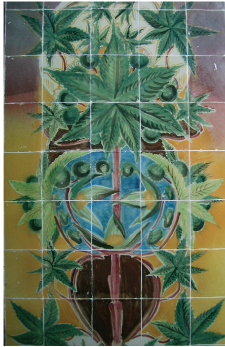
Figura 3 – Painel cannabidis sativa no Jardim de Inverno do Sanatório de Sant'Anna. HOSA/SCML/P.

No mesmo concelho mas, no Estoril, há um painel em azulejo intitulado Casal Santo António . Foi colocado numa moradia ao gosto da casa à portuguesa , edificada de 1903 a 1904, segundo projecto do construtor cascalense José Teixeira dos Santos 20 .