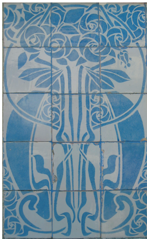
Figura 7 – Motivo padronizado no pórtico de entrada das Casas Álvaro Machado, Estoril.

O pintor foi ao encontro do projecto arquitectónico. Realizando vários painéis de forma a realçar as formas e fachadas, criando uma ilusão de escala e unidade. Na fachada principal é um grande painel com a representação de uma mulher. Está vestida com vestes etéreas e do seu ventre partem círculos. Na fachada tardoz temos o oposto, um homem de barbas, vestes que lhe cobrem o corpo e segura uma pequena flor na mão. Estas duas figuras têm uma auréola composta por círculos. Nos restantes painéis o sinuoso entrelaçar e luxuriante de curvas que sugerem folhas estilizadas, assim como flores abstratas e animais, conjuga-se admiravelmente com formas geométricas (sendo o círculo o mais utilizado). Este conjunto Arte Nova é um dos mais originais e raros no nosso país (Fevereiro, 2012, p.51-60).