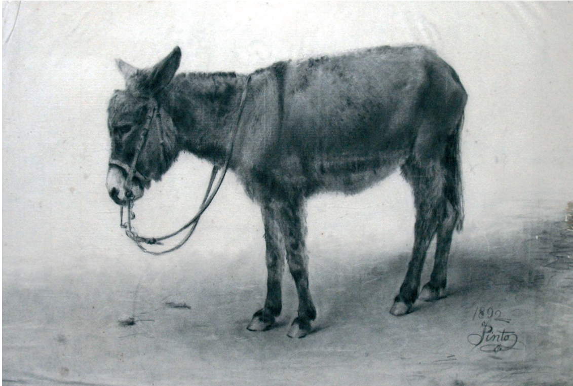
Figura 2 – Desenho a carvão de um burro, assinado e datado de 1892.

Concorre ao prémio Anunciação, no ano letivo de 1893 a 1894, e estava no 2º ano do curso de pintura histórica. Não ganha e o premiado foi Augusto Pascoal Correia Brandão 14 .