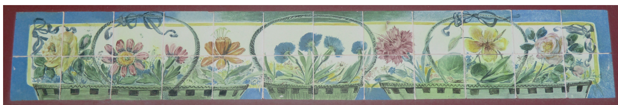
Figura 9 – Painel no edifício Artur Guilherme Robert, Lisboa.

Em 1929 realiza vários painéis para o edifício Artur Guilherme Robert, na Rua de Santa Catarina. Nos painéis pequenos representou cestos de vime com arranjos florais polícromos. No grande painel, com cercadura em volutas e concheados, pintou composições florais polícromas.