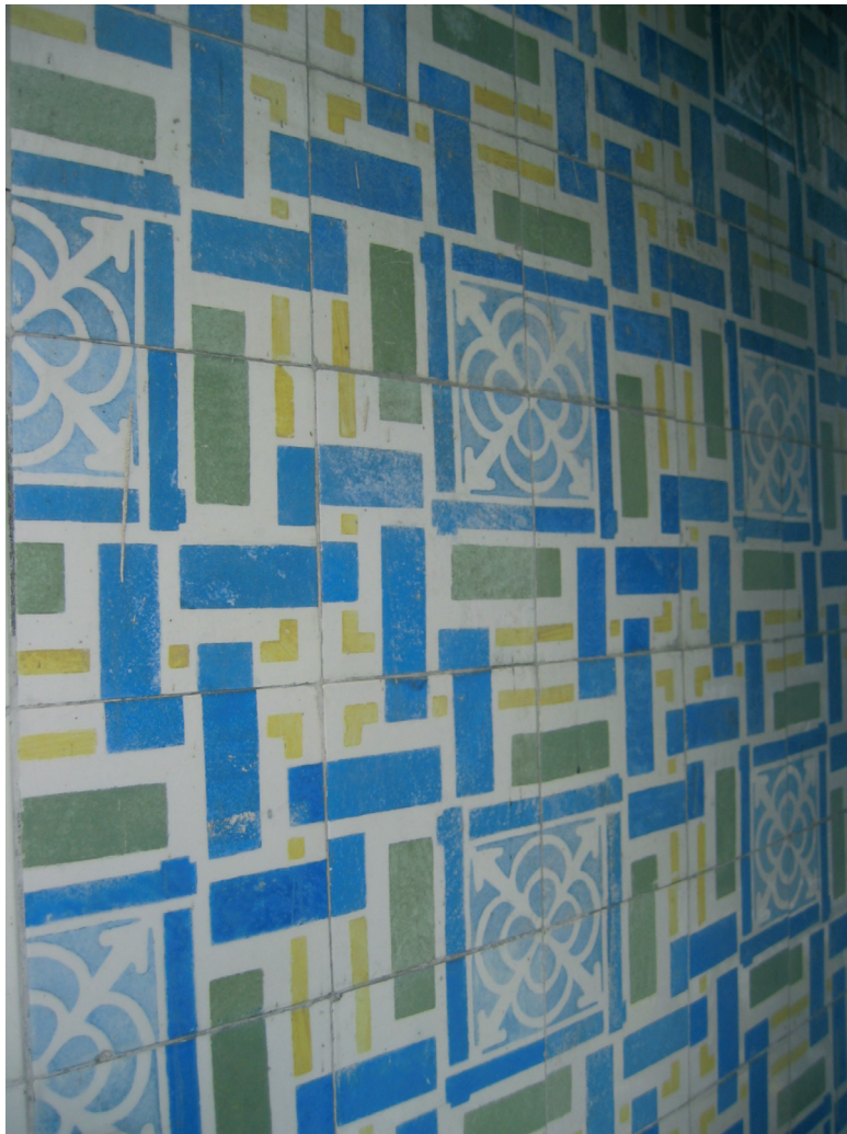
Figura 5 – Motivo padronizado em azulejo na varanda coberta do Colégio Roussel.

Para este edifício o pintor elabora seis motivos padronizados para o exterior. Neles explora o uso de cores contrastantes, de figuras geométricas, de estilização de folhas e símbolos religiosos ao gosto românico, que se complementam admiravelmente. O motivo da varanda coberta é um dos mais inovadores de todos. Ao centro está um motivo estilizado, envolto por dois quadrados, estes são interrompidos por figuras geométricas. Esta complexa conjugação, de grande qualidade estética, confere dinamismo e um certo abstracionismo.