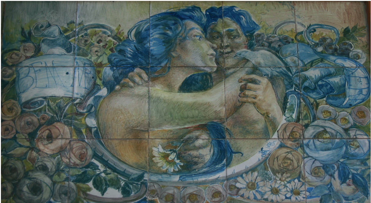
Figura 8 – Painel Bem me quer para o chalet-retrete construído no Parque Silva Porto.

De 1916 a 1917 volta a usar preponderantemente o azul sobre fundo branco.