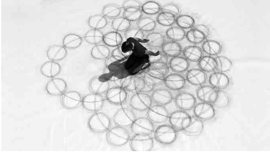
Figura 1 · Tony Orrico durante la Performance: Penwald: 8: 12 by 12 on knees , 2011, grafito sobre papel, 6-7 horas aprox., 609,6 x 609,6 cm.