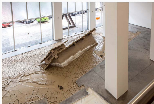
Figura 2 – Ai, pareciam eternas! (3 lamas) (2012) 17

A memória muitas vezes retomada em poemas de Drummond configura como culpa familiar irremissível ou, de maneira paradoxal, como esquecimento. Nuno Ramos, por sua reverência declarada ao poeta mineiro, muitas vezes, cita-o em entrevistas ou mesmo cria instalações que dialogam com a poética drummondiana, o que se pode notar em Ai, pareciam eternas (3 lamas) , instalação de fragmentos de três casas submersas em lama com arquitetura barroca similar à colonial mineira ainda vista nas ruas de Ouro Preto, Minas Gerais.