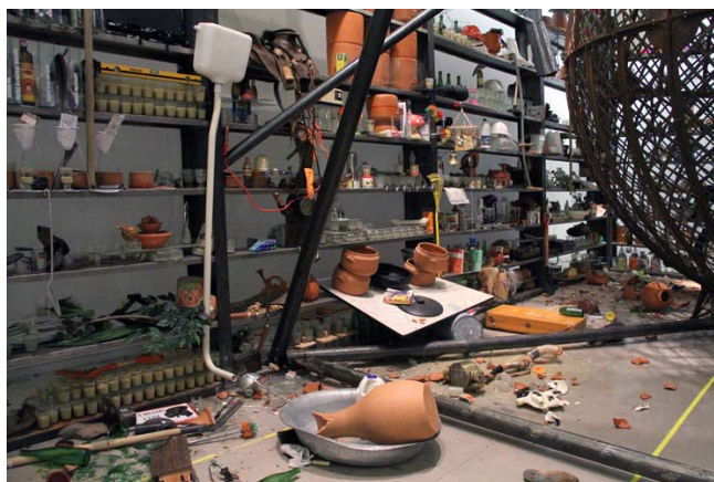
Figura 5 – O globo da morte de tudo (2012) 20

A morte metaforizada nas novecentas páginas em branco atravessadas por um tiro de bala calibre 38 no livro Balada , publicado em 1995, remete à violência, embora não seja a intenção de Nuno Ramos, que pretende fugir do lugar-comum: a violência urbana ou o anúncio da morte da literatura.