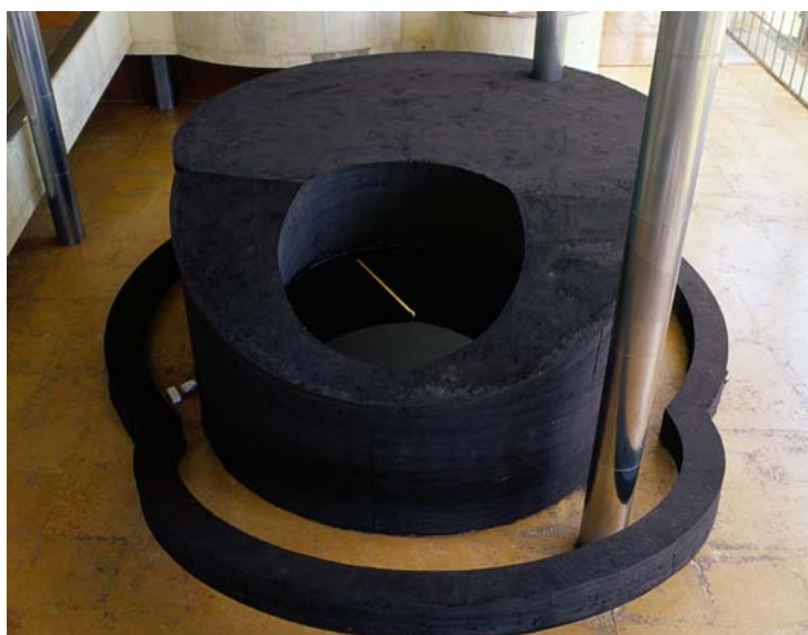
Figura 1 – O que são as horas? (2003) 16

Em O que são as horas? , obra monumental feita com areia queimada comprimida, óleo queimado e relógios, o significado do tempo abstrato se materializa em um objeto gigantesco que remete ao relógio, elemento que oprime e domina o ser humano.