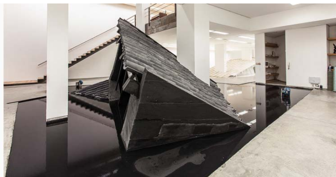
Figura 3 – Ai, pareciam eternas! (3 lamas) (2012) 18