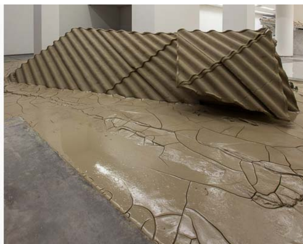
Figura 4 – Ai, pareciam eternas! (3 lamas) (2012) 19

A obra exposta em 2012 na galeria Celma Albuquerque, em Belo Horizonte, tem inspiração originada do poema “Morte nas casas de Ouro Preto”, publicado em 1951, no livro Claro Enigma . As casas e as paredes que assistiram à história de Vila Rica, nome antigo da cidade, constituem uma imagem em ruína diante dos olhos do eu lírico que as reconhece vulneráveis à ação do tempo, “ai, pareciam eternas!/ Não eram” (ANDRADE, 2012, p. 69). Ao assistir à desintegração das casas, o eu lírico nota que retornam ao pó de que foram feitas, chamadas pelo chão, as estruturas são levadas pela enxurrada provocada pela chuva. Assim, o eu lírico conclui que