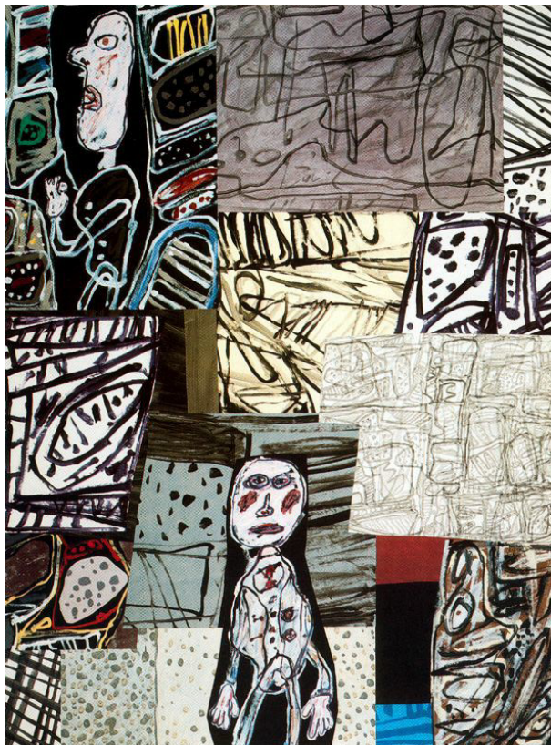
Fig. 2 – Jean Dubuffet, Temporary Situation , 1978. Acrílico sobre papel, 248 x 185 cm.

Na obra Temporary Situation de 1978, Dubuffet sobrepõe uma série de texturas que parecem terem sido extraídas de uma preparação microscópica com diferentes ampliações. As duas figuras humanas parecem ter como fundo o que restou de ramos, raízes, folhas, sementes, depois de um protocolo de extração. Eliminados os polissacarídeos, eliminadas as substâncias fenólicas, o que resta é a única coisa que a pintura quer dar a ver, o modo como somos afetados pelos elementos. Elementos riscados de diferentes espessuras percorrem o espaço, mais curvilíneos nuns pontos, mais rápidos noutros, destacam por vezes uma forma, definem outra. Formas muito simples, apontadas, esquiçadas, amontoam-se por todo o espaço, mais ou menos perceptíveis, parecendo por vezes sobrepor-se, anulando ou ocultando outras formas. Espaços negativos são também figuras e fundo de formas próximas, figuras são também o fundo de linhas riscadas a preto, fundos sobrepõem-se a formas que são também elas figuras e fundos, em jogos que são mais claros em torno das duas personagens onde estamos na presença do fundo preto da obra. A relação figura-fundo nesta troca e permeabilidade constante resulta muito apelativa para o olho.