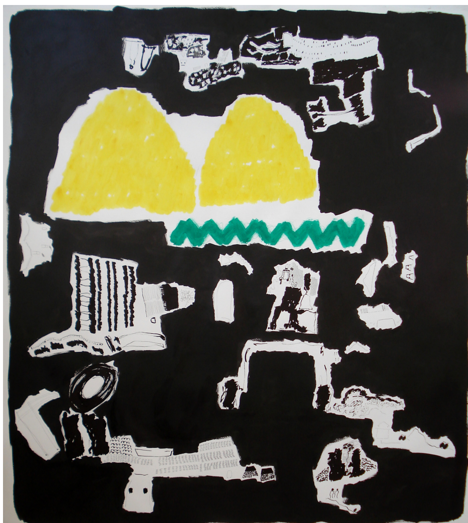
Fig. 10 – Sara Pereira, Série com Preto I , 2012. Técnica mista sobre papel, 160 x 150 cm.

No segundo grupo de trabalhos (pág. 47 à 54), as formas estão organizadas em pequenos grupos e, apesar de terem sido introduzidas no espaço do centro para a periferia, o movimento de dispersão não é tão claro. Estes espaços transmitem a sensação de que cada conjunto de formas constitui uma espécie de ilha com ancoragem própria. É como se um espaço, que havia estado colocado muito próximo do centro efervescente da criação, se tivesse afastado e passasse a registar vários centros ou um centro umas horas depois da explosão inicial.