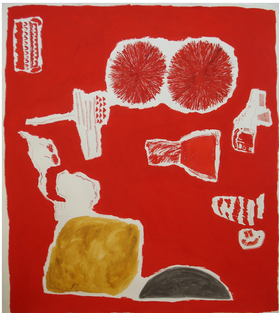
Fig. 1 – Sara Pereira, Série com Vermelho I , 2012. Técnica mista sobre papel, 160 x 150 cm.

Em relação ao projeto prático, apresentado na parte IV, este incide sobretudo nos momentos iniciais do processo criativo. Procura-se dinamizar a relação figura-fundo mantendo todas as formas próximas da força motora que as impulsiona. Os momentos iniciais do processo criativo foram, de alguma forma, continuamente visitados ao longo do processo.