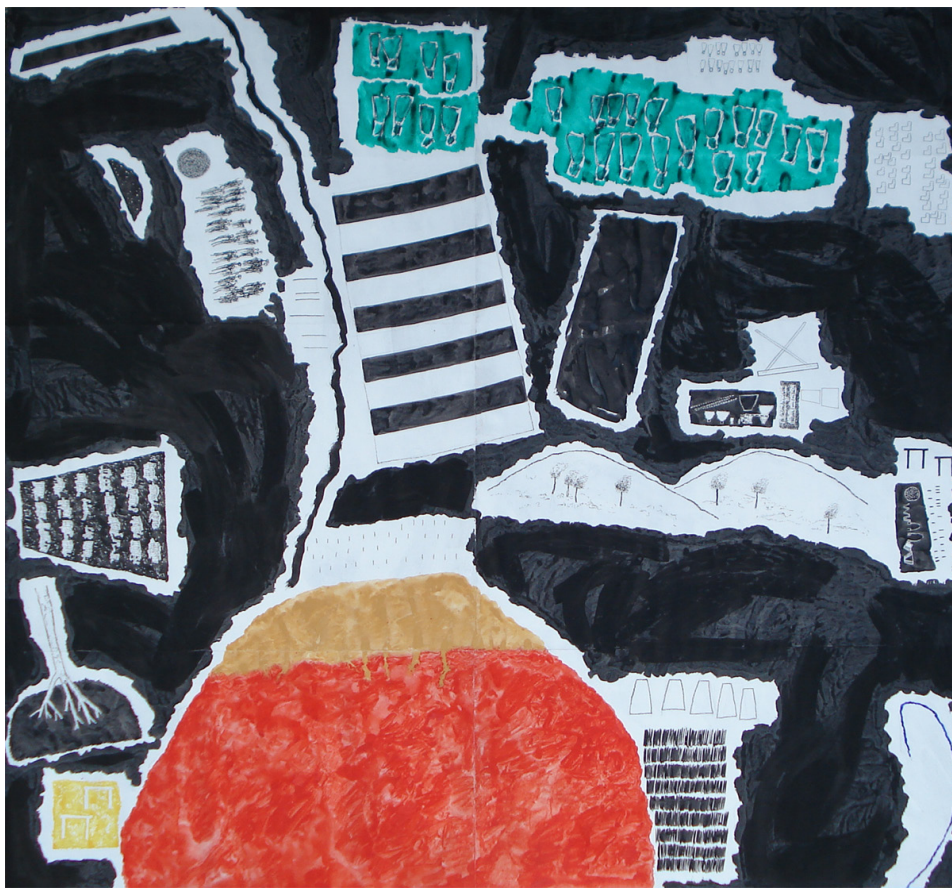
Fig. 14 – Sara Pereira, Série Preto II 1/2 , 2013. Acrílico, guache e tinta-da-china sobre papel, 200 x 190 cm.