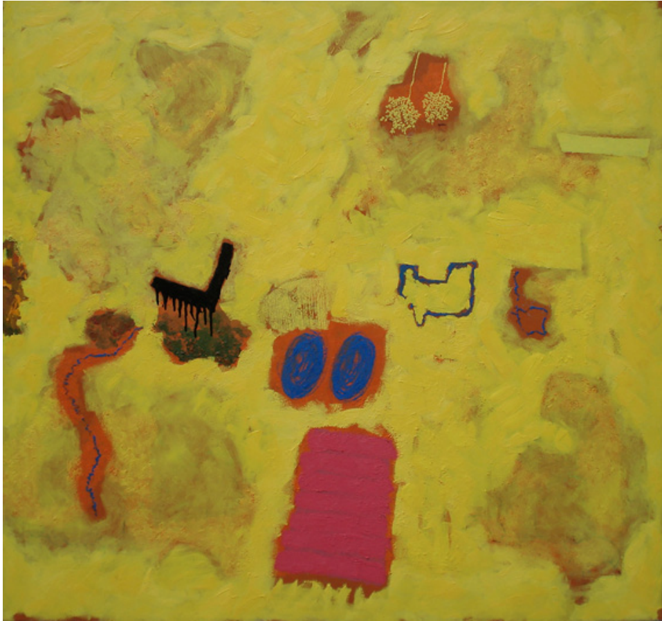
Fig. 8 – Sara Pereira, Sem Título , 2012. Óleo sobre tela, 160 x 170 cm.