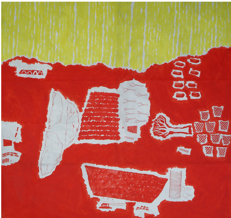
Fig. 16 – Sara Pereira, Série com Amarelo 2/2 , 2013. Acrílico e tinta-da-china sobre papel, 200 x 190 cm.