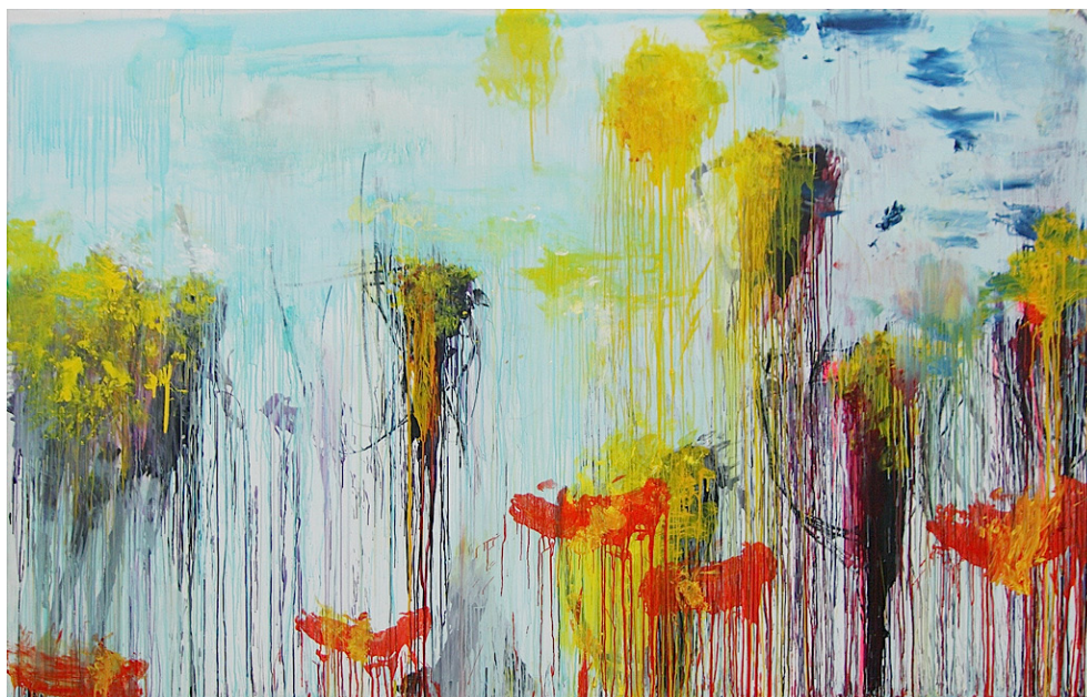
Fig. 3 – Cy Twombly, Lepanto , 2001 Acrílico, grafite e lápis de cera sobre tela, 216.5 x 311.8 cm.

não está, já é passado, aconteceu. O presente é difícil de encontrar, as cores fundem-se, esbatem-se, moldam-se novas cores, novas transparências, novas formas. Em Lepanto a matéria extravasa o toque do pincel sobre armações que parecem balançar num ponto do espaço ainda por descobrir. Os vários elementos projetam-se para cima, com os olhos postos no azul do céu, dão ares de quem faz esta rota há gerações, sempre dignas, sempre efêmeras.