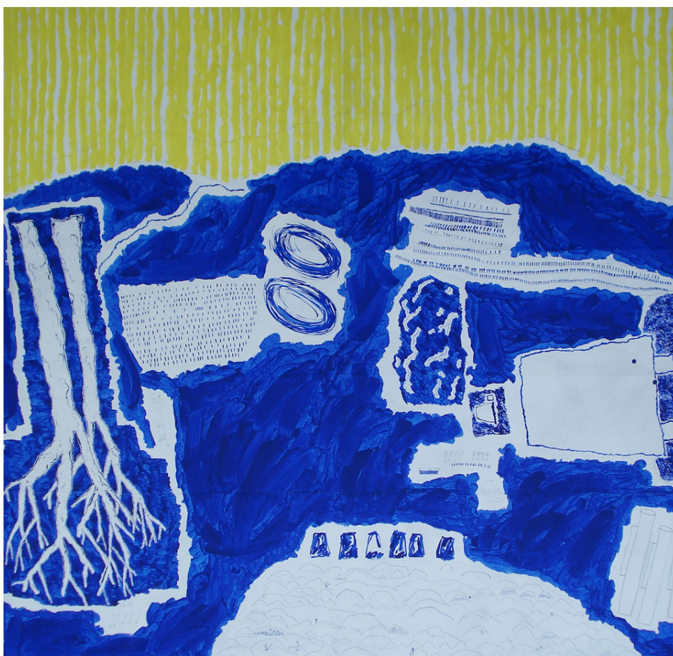
Fig. 17 – Sara Pereira, Série com Amarelo 1/2 , 2013. Acrílico e tinta-da-china sobre papel, 200 x 190 cm.