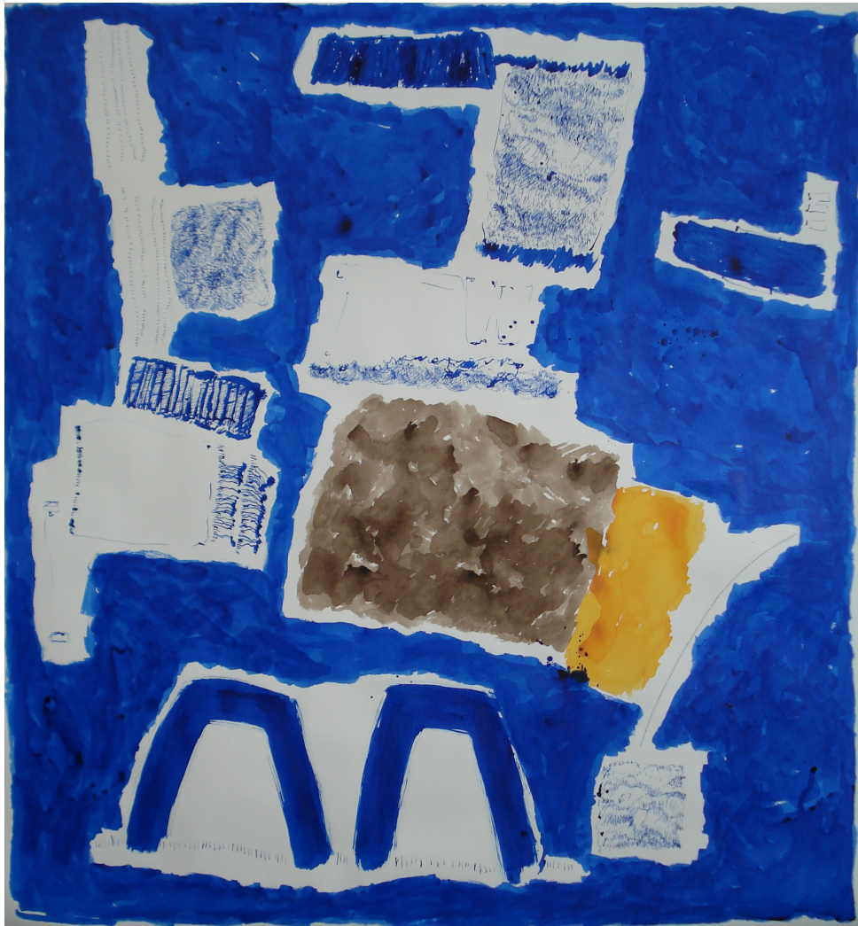
Fig. 11 – Sara Pereira, Azul , 2013. Técnica mista sobre papel, 160 x 150 cm.