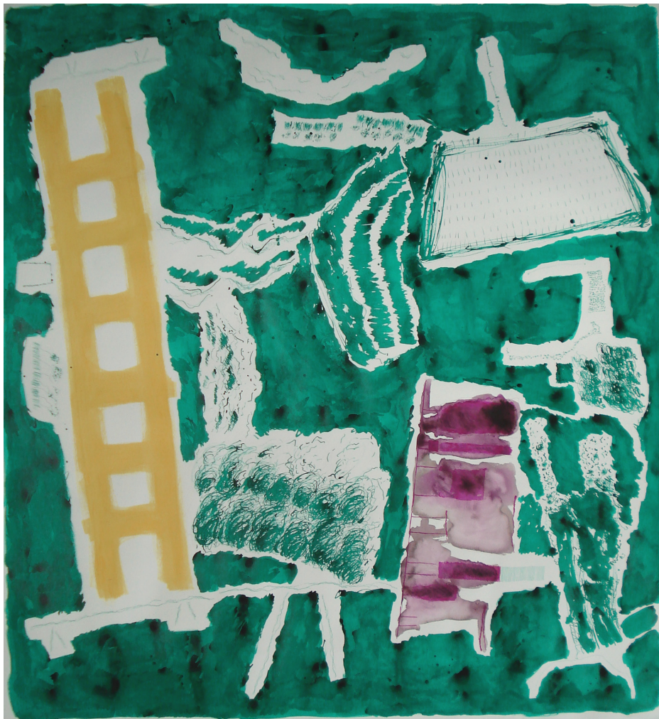
Fig. 12 – Sara Pereira, Verde , 2013. Acrílico, guache e tinta-da-china sobre papel, 160 x 150 cm.