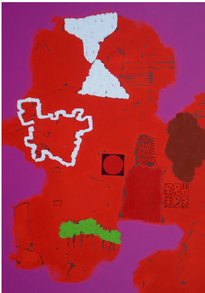
Fig. 6 – Sara Pereira, Sem Título , 2011. Técnica mista sobre tela, 140 x 96 cm.

No sentido de acentuar as diferenças entre os tempos de execução das formas, procurou-se, principalmente nas duas obras apresentadas acima, reduzir algumas das formas a uma linha solta que indica pouco mais do que o seu lugar no espaço e a sua escala. Estas formas, reduzidas a um gesto mínimo, foram as primeiras a serem incluídas no espaço, sendo os restantes elementos inseridos um a um a partir destes primeiros apontamentos. Estes esboços muito rápidos marcam o tempo de partida para a ocupação do espaço com formas com outros tempos de execução. As formas foram inseridas no espaço do centro para a periferia e foram iniciadas e terminadas antes de se passar para o elemento seguinte. Terminada a forma anterior, procurou-se compreender que características deveria ter a forma a inserir ao lado – cor, escala, textura, etc. – de maneira a criar tensões com os elementos já presentes. Depois de compreender de um modo geral o que pode interessar ao espaço como um todo, esta visão é de alguma