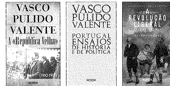
A «REPÚBLICA VELHA» Vasco Pulido Valente