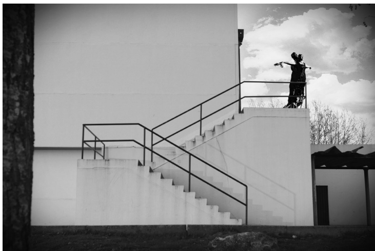
Figura 1 · Síntese do percurso feito por um aluno para a produção da sua imagem.