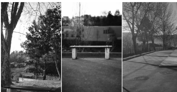
Figura 3 · Síntese do percurso feito por uma aluna para a produção da sua imagem. Fonte: própria. Figura 4 · Síntese do percurso feito por vários alunos na primeira fase do trabalho. Fonte: própria. Figura 5 · Vários resultados finais, de vários alunos, na última fase do trabalho. Fonte: própria.