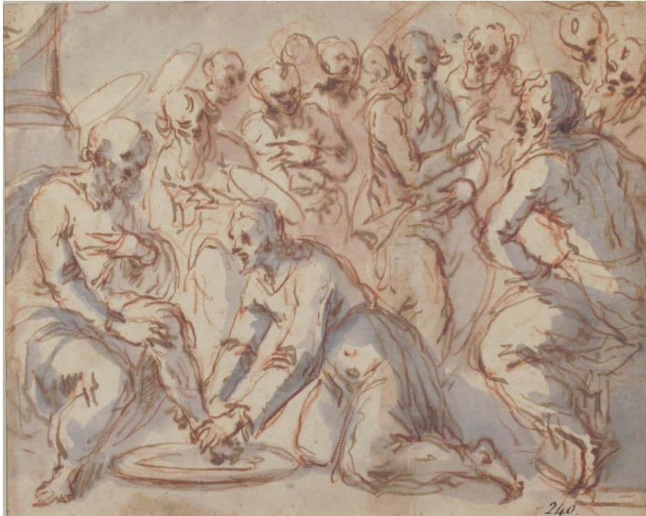
Fig. 3 Francesco Vanni (atribuído), Cristo a lavar os pés dos discípulos , 1563-1610 (Sanguínea e tinta s/papel).

Museu: Metropolitan Museum of Art, Nova Iorque, EUA.