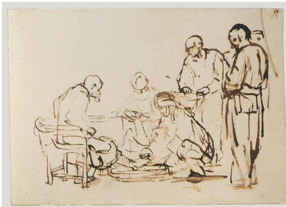
Fig. 5 Rembrandt van Rijn, Cristo lava os pés dos discípulos, c. 1645-1650 (tinta com cana e pincel s/papel). Museu: Rijks Museum, Amesterdão, Holanda.