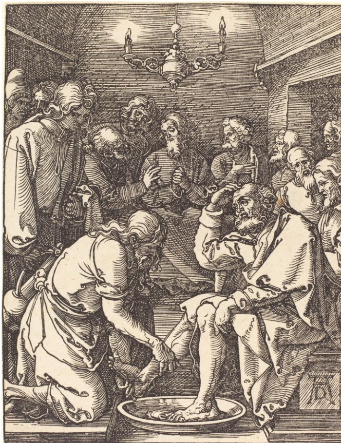
Fig. 1 Albrecht Dürer, Cristo ajoelhado a lavar os pés de S. Pedro, c. 1510-1515 (Xilogravura). Museu: The British Museum, Londres, Reino Unido.

Voltando então ao cerne da questão, como se chega ao desenho partindo dos escrúpulos e do lava-pés? Numa primeira fase, interessa destacar as várias abordagens por parte de outros autores. Escolheram-se apenas desenhos, dado o tópico desta investigação, apresentados de modo cronológico.