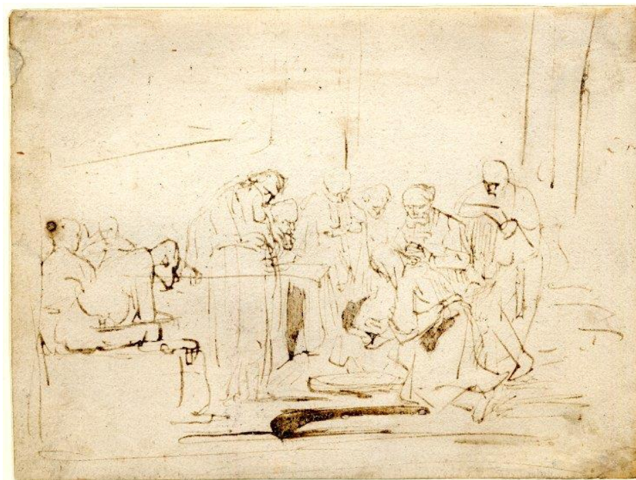
Fig. 4 Rembrandt van Rijn, Cristo lava os pés dos discípulos , c. 1628-1629 (tinta com cana e pincel s/papel).

Fonte: https://www.metmuseum.org/art/collection/search/340901