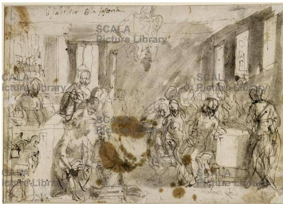
Fig. 2 Paolo Caliari (Veronese), Estudo para O lava-pés , c. 1586 (Aguarela e aparo s/papel). Museu: Kupferstichkabinett - Staatliche Museen, Berlim, Alemanha.

Observando atentamente as cinco figuras, o denominador comum é simples de constatar: o centro da ação é um homem (Jesus) a lavar os pés a outro (Pedro). As referências ao contexto envolvente variam entre o interior (figs. 1 e 2), sugestões arquitetônicas que não explicitam interior ou exterior (figs. 3 e 4) ou ausência de contexto construído (fig. 5).