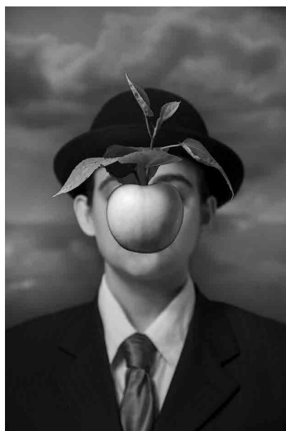
Figura 1 · Magritte. Coletivo Mimese, 2016.