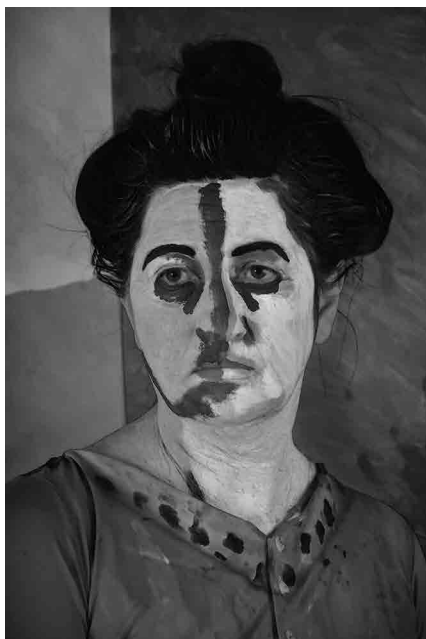
Figura 8 · Referência Matisse (Portrait of Madame Matisse, 1905), Coletivo Mimese, 2016.