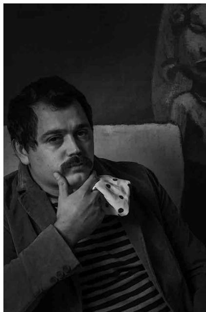
Figura 9 - Referência Paul Gauguin (Autorretrato com ídolo, 1893), Coletivo Mimese, 2016.