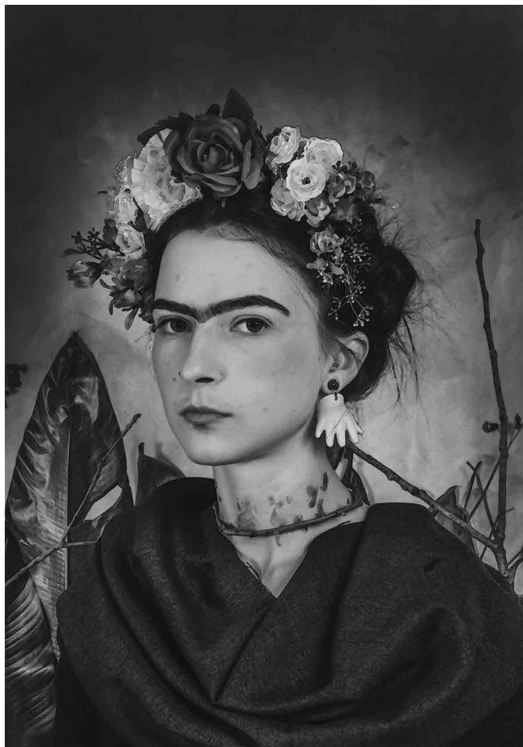
Figura 4 - Referência Frida Kahlo (Autorretrato dedicado ao Dr. Eloesser, 1940). Coletivo Mimese, 2016.