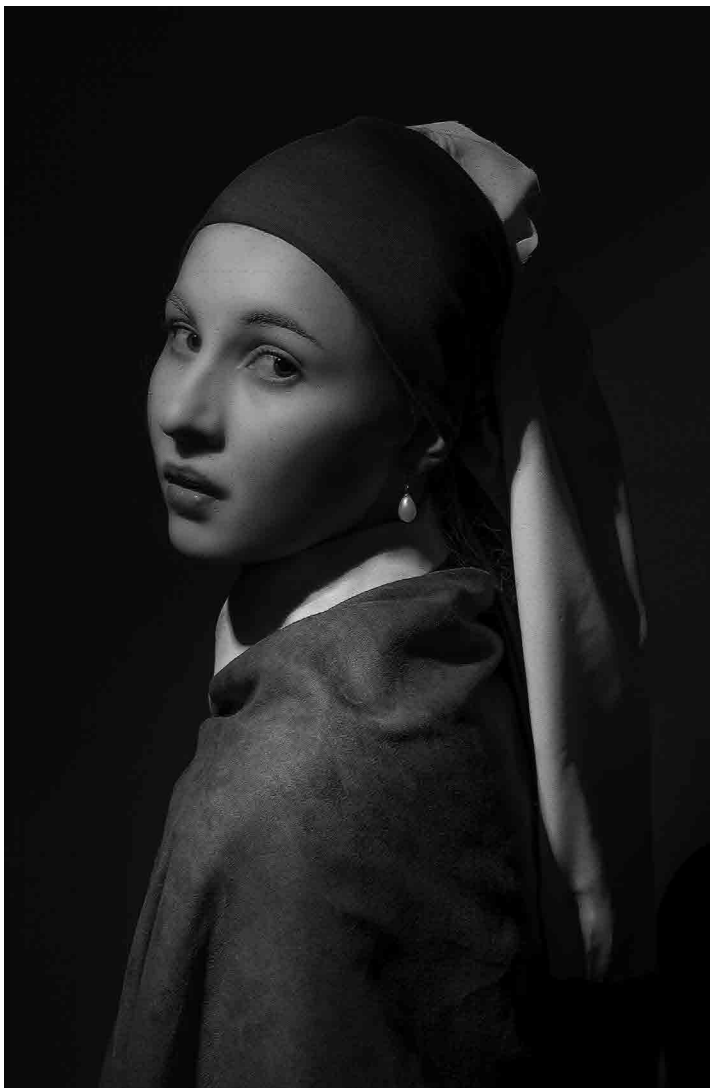
Figura 3 · Referência Johannes Vermeer (Moça com brinco de pérola, 1665), Coletivo Mimese, 2016.