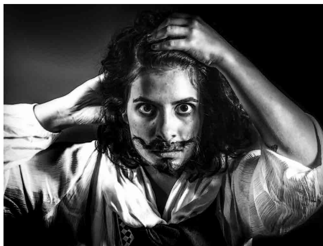
Figura 5 · Referência Leonardo Da Vinci (La Gioconda, 1503). Coletivo Mimese, 2016.