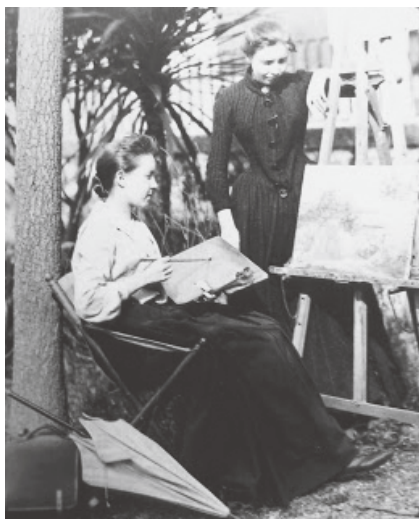
Figura 1 · Fotografias de Aurélia de Souza, Coleção Casa Museu Marta Ortigão Sampaio, Porto.