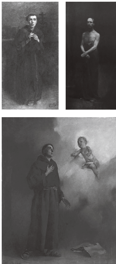
Figura 2 · Aurélia de Souza, Santo António , c.1902. Óleo sobre tela. Coleção Casa Museu Marta Ortigão Sampaio, Porto. Fonte: www.balcaovirtual.cmporto.pt/PT/cultura/museus/casamuseumartaortigaosampaio/AureliadeSouza/Paginas/Aur%C3%A9liadeSouza.aspx – António Carneiro, Ecce-Homo , 1901, Óleo sobre tela. Coleção Museu da Quinta de Santiago, Matosinhos. Fonte: www.uploads1.wikiart.org/images/antonio-carneiro/ecce-homo-1901.jpg – Columbano Bordalo Pinheiro, Santo António , 1898. Óleo sobre tela. Coleção Museu do Chiado, Lisboa. Fonte: www.doportoenao.so.blogspot.pt/2012/07/barroquismos-vii-7.html