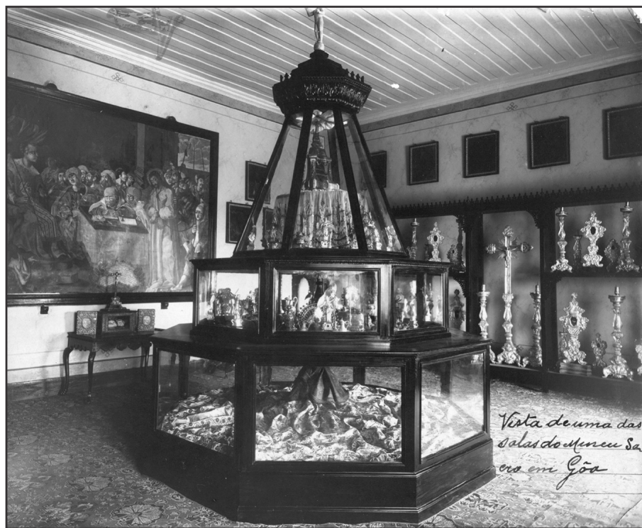
Fig. 1 - Pormenor do Museu de Goa no início do século XX

Instalado no palácio de S. Caetano, na velha Gôa, o Museu Real da Índia Portuguesa (1896), como se designaria, deveria exhibir, a par de peças de outras categorias e tipologias materiais, “[...] os destroços archeologicos da India mussulmana e da India hindu, devendo inaugurar-se tambem uma secção de pre-historia goana , collecções de armas das epocas da pedra lascada e da pedra polida , e dos primeiros metaes empregados, todo um trabalho original a fazer e a juntar.” (Documentos relativos..., 1904: 4. Itálicos nossos) ( Fig. 1 ). Decisão certamente decorrente do interesse individual de membros da CAIP pela arqueologia, à qual não teria sido alheio o exemplo do apoio pecuniário para escavações concedido pelo arqueólogo e proprietário vimarenense Francisco Martins Sarmiento (1833-1899), membro da RAACAP e da Sociedade de Geografia de Lisboa (1875) (Documentos relativos..., 1904: 1-15).