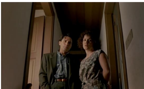
Fig.33 – Manoel de Oliveira, O Dia do Desespero (1992), 75 minutos, 35 mm, 0:27:14.

Mário Barroso: Provavelmente. A única porta para a liberdade total (Oliveira, 1992, 0:27:24).