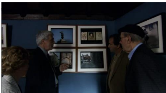
Fig. 5 — Manoel de Oliveira, Cristóvão Colombo – o Enigma (2007), 75 minutos, 35 mm, 1:07:47.

Em Cristóvão Colombo, o Enigma (2007), Manuel Luciano da Silva, médico luso-americano, e Sílvia Jorge da Silva viajam motivados pelo gosto e pela curiosidade que a história do país e dos feitos dos Descobrimentos lhes suscita. Ao mesmo tempo, o casal empenha-se em comprovar a origem portuguesa de Cristóvão Colombo. Isto leva-os a visitar alguns monumentos e a conhecer três museus, que serão explanados no subcapítulo 2.3.3 deste trabalho. A visita guiada marca também esta longa-metragem dedicada à viagem. Destacamos as últimas sequências do filme que são passadas na Casa de Colombo em Porto Santo, onde ocorre um pequeno tour conduzido pelo diretor, papel atribuído a Luís Miguel Cintra. Este acompanha e debate algumas ideias com Manuel e Sílvia (Fig.5). Segundo a nossa leitura, nesta obra, a visita guiada pode ser enquadrada na tipologia de visita didática.