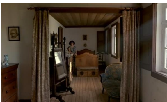
Fig.28 – Manoel de Oliveira, O Dia do Desespero (1992), 75 minutos, 35 mm, 0:19:47.