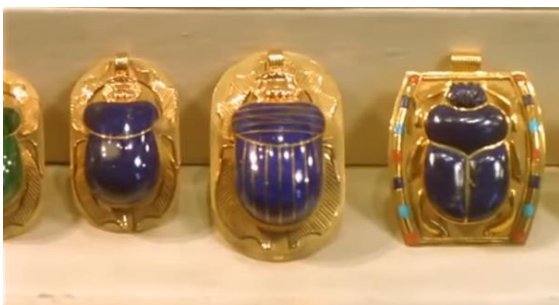
Fig.1 – Manoel de Oliveira, Um Filme Falado (2003), 95 minutos, 35 mm, 0:42:35.

e mostra às protagonistas uma série de joias em forma de escaravelho em exposição num hotel do Cairo. Nesta cena, a câmara adopta o ponto de vista do objeto exposto (Fig.2) e, de forma intercalada, assume também o olhar das personagens, dando-nos a ver a coleção, através de um curto travelling que percorre a vitrine (Fig.1). Tudo isto enquanto o ator fala sobre a simbologia e importância daqueles insetos para a antiga civilização egípcia.