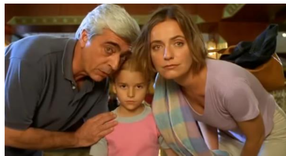
Fig.2 – Manoel de Oliveira, Um Filme Falado (2003), 95 minutos, 35 mm, 0:42:46.

No filme de 2009, Singularidades de uma Rapariga Loura , adaptação do conto homónimo do escritor Eça de Queirós (1845-1900), a visita guiada surge num excerto filmado no interior do Círculo Eça de Queiroz, em Lisboa. A cena, que dura menos de um minuto, foi, claramente, um desvio de Oliveira ao texto queirosiano.