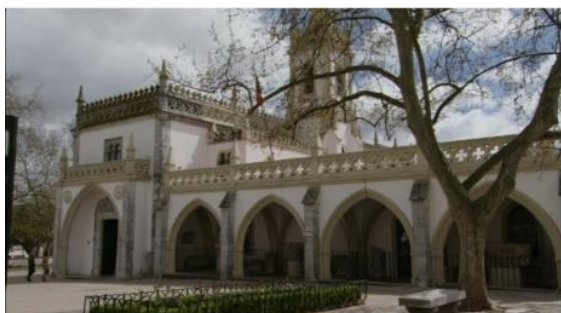
Fig.9 – Manoel de Oliveira, Cristóvão Colombo – o Enigma (2007), 75 minutos, 35 mm, 0:35:41.

Todos os interiores dos espaços museológicos que são visitados e percorridos pelas personagens são exibidos sem mais visitantes e sem funcionários, tirando os diretores. As instituições são identificadas através de planos das fachadas. Destacamos o plano sequência que regista a chegada à Casa de Colombo, no qual vemos as personagens, de costas, a dirigirem-se para o museu (Fig.12) e que nos remete para um plano do filme Famalicão de 1940, analisado numa fase posterior deste trabalho (ver Fig.18).