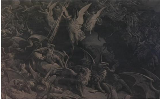
Fig.35 – Manoel de Oliveira, O Dia do Desespero (1992), 75 minutos, 35 mm, 0:28:22.

A partir desta sequência, Mário Barroso assume a personagem de Camilo até ao fim do filme, enquanto a atriz continua a assegurar os dois papéis e se encarrega dos momentos de visita guiada e da narração dos acontecimentos, mantendo-se também como o elemento externo à dimensão ficcional.