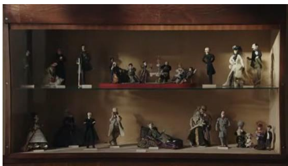
Fig. 3 — Manoel de Oliveira, Singularidades de Uma Rapariga Loura (2009), 63 minutos, 35 mm, 0:17:52.

Entendemos que neste excerto encontramos uma visita guiada programática, uma vez que serve para acentuar o caráter anacrónico no filme.