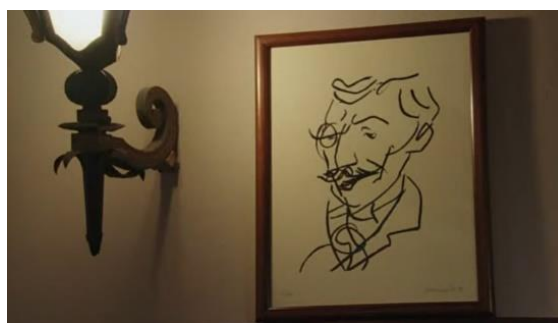
Fig.4 — Manoel de Oliveira, Singularidades de Uma Rapariga Loura (2009), 63 minutos, 35 mm, 0:18:01.