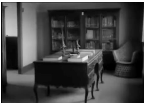
Fig. 19 – Manoel de Oliveira, Famalicão (1940), 23 minutos, 35 mm, 0:05:03.