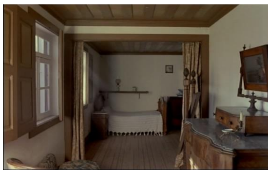
Fig.29 – Manoel de Oliveira, O Dia do Desespero (1992), 75 minutos, 35 mm, 0:24:16.

Por fim, a casa é mencionada num diálogo entre os protagonistas, no qual se referem ao património edificado como a materialização da existência do romancista que, assim como a sua obra literária, permite uma aproximação ao autor: