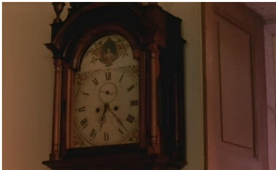
Fig.21 – Manoel de Oliveira, O Dia do Desespero (1992), 75 minutos, 35 mm, 0:51:46.