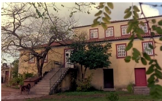
Fig.27 – Manoel de Oliveira, O Dia do Desespero (1992), 75 minutos, 35 mm, 0:14:53.

Em seguida, vemos a fachada da casa amarela através de um plano de conjunto (Fig.34), do qual se destaca a acácia e um cão, no canto inferior esquerdo. O animal, que faz referência a um dos cães de Camilo, é o elemento que inscreve esta imagem na esfera da ficção.