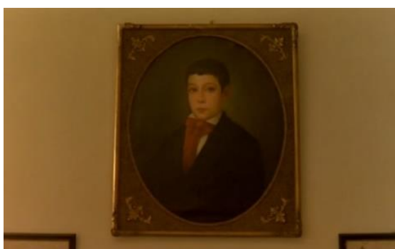
Fig.37 – Manoel de Oliveira, O Dia do Desespero (1992), 75 minutos, 35 mm, 0:58:51.

Ana Plácido: Manuel Augusto Plácido Pinheiro Alves (Oliveira, 1992, 0:58:49).