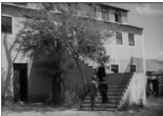
Fig. 18 – Manoel de Oliveira, Famalicão (1940), 23 minutos, 35 mm, 0:04:48.

Como refere João Lopes a propósito dos planos de objetos em Famalicão : a “[...] identificação dos objetos [...] é feita no sentido de os individualizar, emprestando-lhes uma autonomia iconográfica [...]” (Lopes, 2001, p.65).