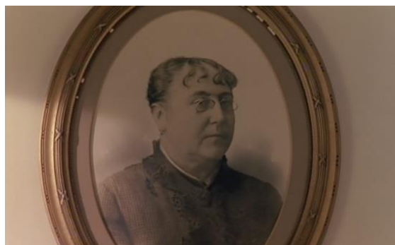
Fig.32 – Manoel de Oliveira, O Dia do Desespero (1992), 75 minutos, 35 mm, 0:16:45.

Dando continuidade à digressão pela coleção de quadros através das imagens em movimento, os dois atores mencionam mais duas obras. Ao contrário dos exemplos já citados, agora não são retratos, mas duas gravuras que merecem o destaque. Num plano em ângulo contrapicado, os intérpretes, parados no corredor do piso superior (Fig.33), estabelecem um diálogo entre si sobre duas ilustrações que se encontram expostas no piso inferior e propõem leituras sobre cada uma das imagens.