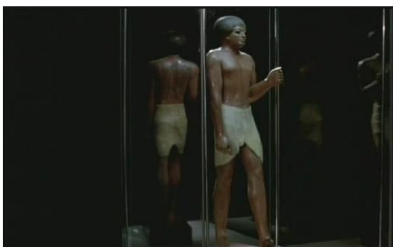
Fig.13 – Manoel de Oliveira, O Improvável não é Impossível (2006), 19 minutos, 35 mm, 0:06:44.