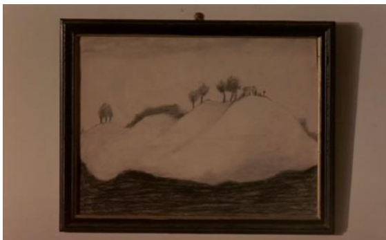
Fig.36 – Manoel de Oliveira, O Dia do Desespero (1992), 75 minutos, 35 mm, 0:49:54.