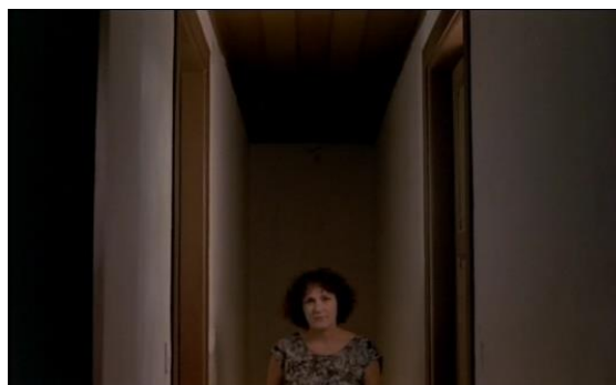
Fig.24 – Manoel de Oliveira, O Dia do Desespero (1992), 75 minutos, 35 mm, 0:19:08.

Por outro lado, o “jogo de máscaras” também é aplicado às divisões da casa, que tão depressa é a morada do século XIX, como se assume enquanto casa-museu (Preto, 2014, p.107). Como o ilustram, por exemplo, os fotogramas do filme nas figuras 25 e 26, que nos permitem ver a mesma zona da sala de trabalho de Camilo Castelo Branco em momentos diferentes do filme. Na primeira imagem, a realidade documentada é a do museu. Em contraponto, na figura 26, vemos uma recriação do ambiente oitocentista em que o espaço e o espólio são utilizados pela personagem do romancista.