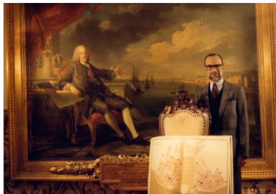
Fig.7 – Manoel de Oliveira, Lisboa Cultural (1983), 61 minutos, 35 mm, 0:37:18.