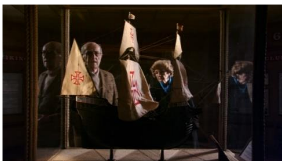
Fig.11 – Manoel de Oliveira, Cristóvão Colombo – o Enigma (2007), 75 minutos, 35 mm, 0:52:48.