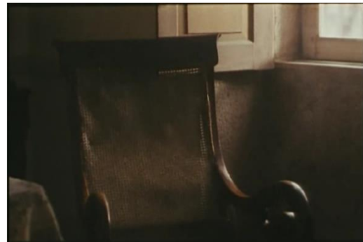
Fig.22 – Manoel de Oliveira, O Dia do Desespero (1992), 75 minutos, 35 mm, 1:02:00.

Pelas declarações de Manoel de Oliveira, compreendemos que a Casa de Camilo, fez parte da génese deste projeto: “[...] seria um filme curto e tinha à minha disposição a casa de Camilo” (Baecque e Parsi, 1999, p.174). Quanto ao processo de trabalho adotado para esta obra, o cineasta esclarece: