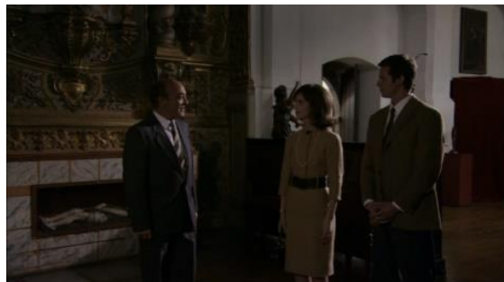
Fig.10 – Manoel de Oliveira, Cristóvão Colombo – o Enigma (2007), 75 minutos, 35 mm, 0:36:21.