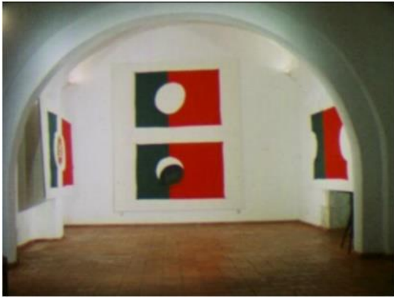
Fig.8 – Manoel de Oliveira, A Propósito da Bandeira Nacional (1988), 7 minutos, 35 mm, 0:02:15.