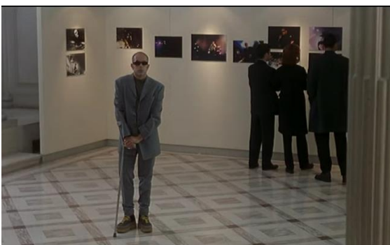
Fig. 15 – Manoel de Oliveira, A Carta (1999), 105 minutos, 35 mm, 1:43:19.

Desta cena importa destacar o recurso aos planos subjetivos para mostrar algumas das fotografias em exibição, e, ainda que ao contrário dos filmes referidos até aqui, o espaço expositivo não é o objeto de interesse, mas sim um elemento desencadeador da ação.