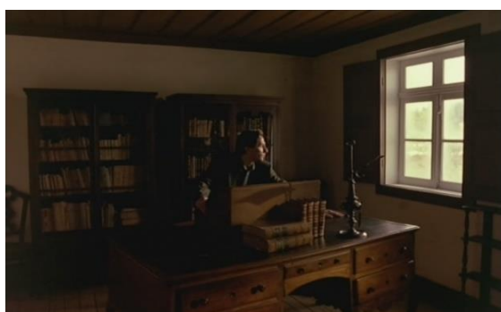
Fig.25 – Manoel de Oliveira, O Dia do Desespero (1992), 75 minutos, 35 mm, 0:15:20.

Por outro lado, o “jogo de máscaras” também é aplicado às divisões da casa, que tão depressa é a morada do século XIX, como se assume enquanto casa-museu (Preto, 2014, p.107). Como o ilustram, por exemplo, os fotogramas do filme nas figuras 25 e 26, que nos permitem ver a mesma zona da sala de trabalho de Camilo Castelo Branco em momentos diferentes do filme. Na primeira imagem, a realidade documentada é a do museu. Em contraponto, na figura 26, vemos uma recriação do ambiente oitocentista em que o espaço e o espólio são utilizados pela personagem do romancista.