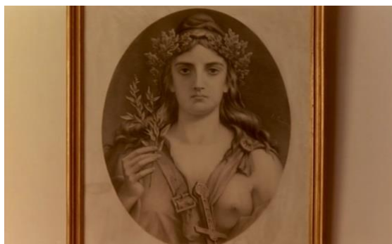
Fig.34 – Manoel de Oliveira, O Dia do Desespero (1992), 75 minutos, 35 mm, 0:27:24.

Teresa Madruga e Mário Barroso destacam ainda a gravura Paraíso Perdido do francês Gustave Doré (1832-1883) que nos é mostrada através de um plano de pormenor (Fig.35). Os comentários ganham um carácter descritivo e interpretativo focado na simbologia dos elementos que compõem a imagem.