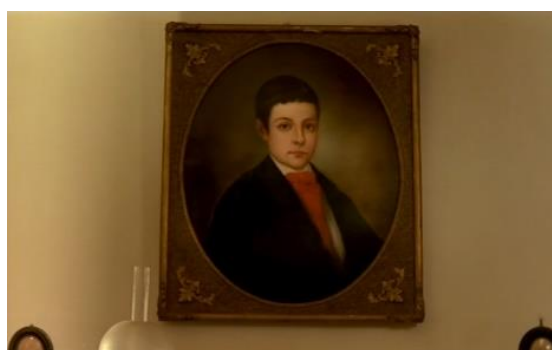
Fig.38 – Manoel de Oliveira, O Dia do Desespero (1992), 75 minutos, 35 mm, 0:59:04.