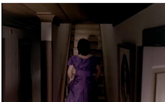
Fig.23 – Manoel de Oliveira, O Dia do Desespero (1992), 75 minutos, 35 mm, 0:18:58.

Assinalamos a sequência em que a arquitetura das escadas interiores de acesso ao primeiro piso participa no exercício de “metamorfose” da atriz em personagem. A intérprete sobe as escadas caracterizada da escritora oitocentista, de costas para a câmara (Fig.23), e ressurge no piso superior, de frente, já “despida” do seu papel (Fig.24). A habitação é explorada enquanto palco e estrutura que permanece estável, na qual as diferentes épocas coabitam e se articulam.