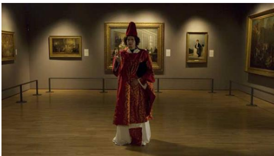
Fig.14 – Manoel de Oliveira, Painéis de São Vicente de Fora, Visão Poética (2010), 15 minutos, digital, 0:01:04.

Dentro do trabalho de Manoel de Oliveira, esta ideia de animar uma obra em exposição também é encontrada em A Estátua (1988), um texto de sua autoria para um filme que não chegou a ser realizado, no qual uma escultura de uma figura masculina, exposta numa galeria, ganha vida (Cinemateca Portuguesa, 1988, p.82).