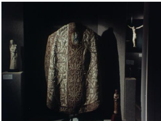
Fig.6 – Manoel de Oliveira, Lisboa Cultural (1983), 61 minutos, 35 mm, 0:28:20.