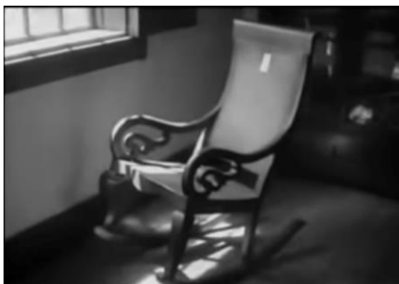
Fig. 20 – Manoel de Oliveira, Famalicão (1940), 23 minutos, 35 mm, 0:05:18.