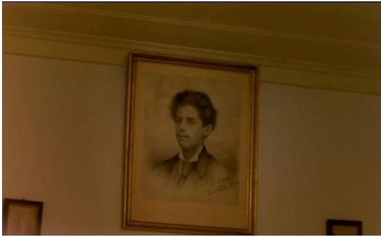
Fig.39 – Manoel de Oliveira, O Dia do Desespero (1992), 75 minutos, 35 mm, 0:59:19.

Uma visita guiada pressupõe a seleção de uma perspectiva e de uma visão dos acontecimentos e, neste filme, constatamos que Manoel de Oliveira escolhe um posicionamento próximo ao da instituição, uma vez que o argumento coincide com o discurso veiculado pela casa-museu.