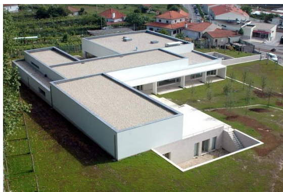
Fig. 17 – Centro de Estudos Camilianos.