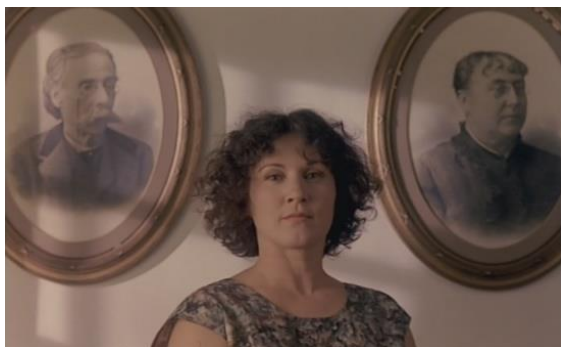
Fig.31 – Manoel de Oliveira, O Dia do Desespero (1992), 75 minutos, 35 mm, 0:16:18.

fingindo ignorar o adultério quando praticado às escondidas e sem escândalo (Oliveira, 1992, 0:16:45).