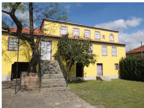
Fig. 16 – Fachada da Casa de Camilo. São Miguel de Seide, 2020.