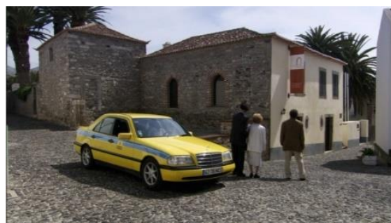
Fig. 12 – Manoel de Oliveira, Cristóvão Colombo – o Enigma (2007), 75 minutos, 35 mm, 1:03:58.