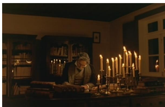
Fig.26 – Manoel de Oliveira, O Dia do Desespero (1992), 75 minutos, 35 mm, 0:44:48.