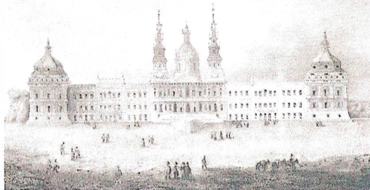
Kloster Mafra in Portugal. Gez. V.G. Reiss