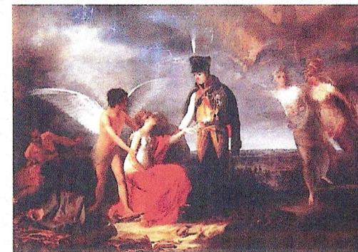
Junot protegendo a cidade de Lisboa. (1808) Domingos António Sequeira. Museu Soares dos Reis

A sociedade portuguesa divide-se: na ausência da corte, alguns dos mais poderosos tomam partido do Exército Francês, entre os quais Domingos António Sequeira, que realiza uma pintura alegórica exaltando os feitos de Junot.