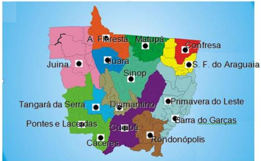
Figura 1: Número de polos e seus respectivos Centros de Formação.