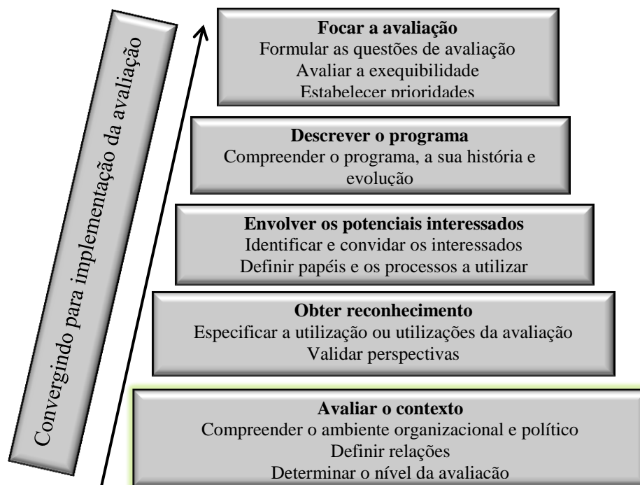
Figura 4. Aspectos a considerar no planejamento da avaliação de programas e de projetos de formação de professores (Adaptada de Holden, D. e Zimmerman, M. A practical guide to program evaluation planning . London: Sage, 2009).

A figura 4 mostra conforme estudos de Fernandes (2009), que o processo de planejamento contribui para focar o objeto primordial da avaliação de programas e projetos, assim como, os de formação de professores, permitindo dar início à concretização da mesma.