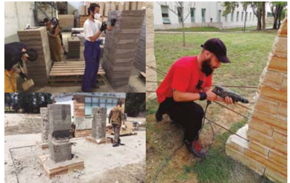
3 Workshop de construção e criação das esculturas em grés nas instalações da fábrica de refratários da Abrigada.

Quanto às propostas artísticas, estas foram desenvolvidas indistintamente pelos participantes, sendo constituídas por uma coleção variada de esboços que depois foram “aperfeiçoados” pelos alunos