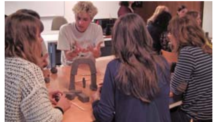
2 2ª sessão de trabalho, materialização das primeiras propostas cerâmicas desenvolvidas pelos participantes.