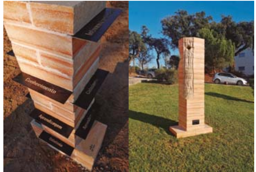
4 Instalação das peças de cerâmica no Campus do Instituto Politécnico de Setúbal.

A arte pública como metodologia coletiva de trabalho tem a capacidade de fazer múltiplas leituras e detetar sintomas a partir do contacto empírico com o território. Leituras e apropriações do ambiente urbano, através da fixação de reflexões, anseios e memórias de todos os envolvidos. Estas experiências, e os seus resultados, tendem a tornar-se uma ferramenta disponível de harmonização e de inclusão social, disponível para diferentes agentes em contextos heterogéneos e complexos como o foi num campus universitário. Como defendem Rato, Verheij e Fernandes (2017):