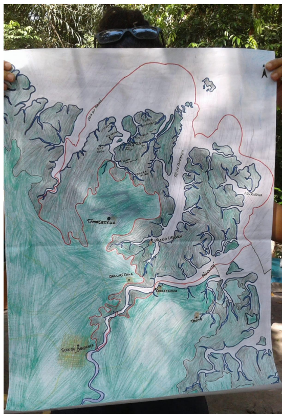
Figura 3: Mapa da comunidade de Bragança usado na apresentação sobre aspectos da região.