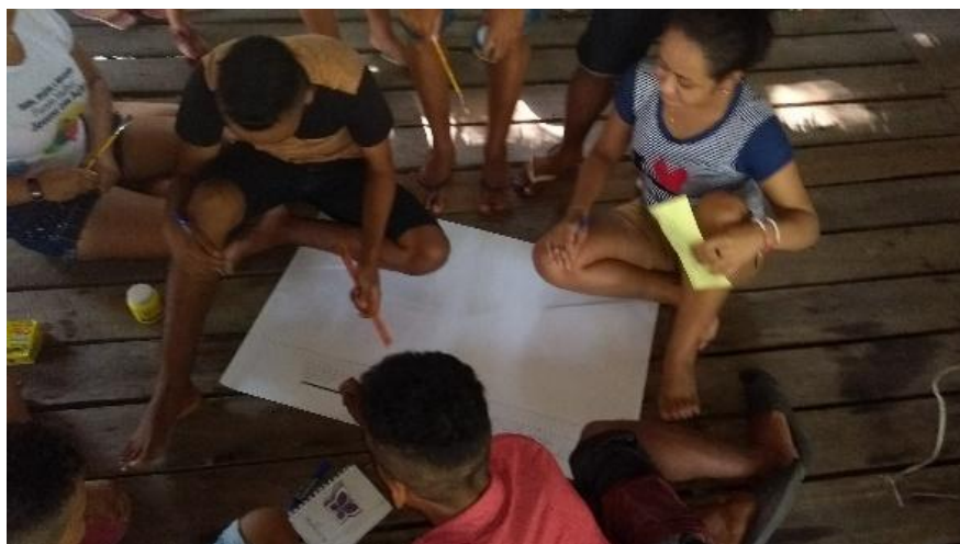
Figura 5: Jovens da Ilha das Araras (Currálinho) produzindo materiais para os debates proporcionados pelo encontro.

uma porção de outras possibilidades de ferramentas: a própria comunidade, suas pontes, o rio, etc (Figura 5).