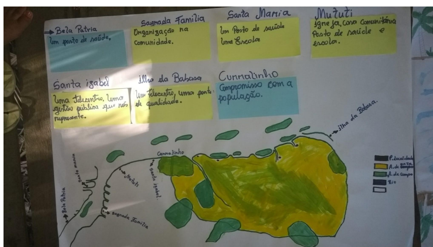
Figura 2: Mapa da comunidade da Ilha das Araras e apontamento das necessidades por localidade.