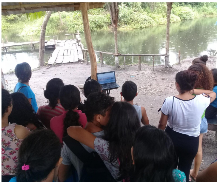
Figura 9: Jovens em Bragança participando de uma das formações.