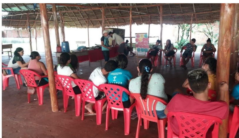
Figura 8: Jovens reunidos em encontro ocorrido em Bragança, Pará.

Outro ponto importante da formação protagonista realizada pela UNESCO foi a possibilidade de, em cada encontro, com duração de dois dias por comunidade, com o mesmo grupos de jovens, poderem debater um tema específico que versava sobre educação ambiental, políticas públicas para a juventude, cultura extrativista, atividade pesqueira e associativismo. A possibilidade de ter um grupo de jovens durante dois dias, convivendo numa espécie de acampamento juvenil foi importante para proporcionar uma imersão protagonista (Figura 8 e 9). Nessa perspectiva foi adotada a ideia de “transdisciplinaridade”, que busca exatamente situar as informações no contexto. Busca retomar a síntese, possibilitar o diálogo entre os diferentes saberes” (Anciães e Rodrigues, 2015, p.21). O intuito é possibilitar o diálogo entre os diferentes saberes a fim de encontrar mecanismos de transformação social.