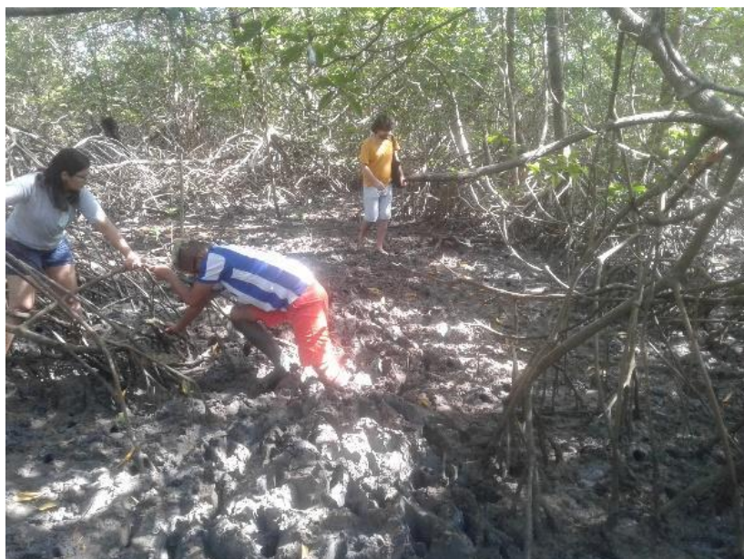
Figura 11: Grupo de jovens atravessando o Manguezal.

A partir daquele momento, conversamos sobre a experiência de atravessar o mangue e, a partir das reflexões, os jovens puderam falar sobre suas concepções e toda carga de significados presentes neste ato. Possibilitando que possamos compreender que “...a experiência apresenta um caráter dinâmico, é questionada e alterada em função das novas situações vivenciais, o que permite a evolução do indivíduo e dá origem a um processo de formação ao longo da vida” (Cavaco, 2009, p. 222).