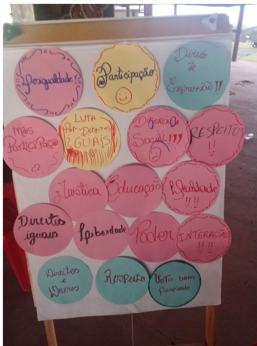
Figura 1: Material produzido pelos jovens na comunidade de Bragança. .

utilizadas dinâmicas de diagnóstico, onde os aspectos referentes à organização da comunidade eram apresentados pelos jovens, por meio da produção de esquemas, desenho, cartazes e mapas (Figura 1, 2 e 3), onde desenvolviam questões que achassem pertinentes, de maneira livre. Esse material era utilizado posteriormente como indutores na criação das ações.