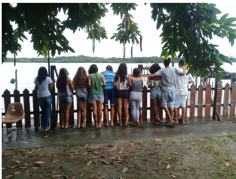
Figura 7: Dinâmica “Olhar para o Futuro” realizada com objetivo de explorar a relação dos jovens com o meio ambiente em Soure, Marajó.

Possibilitamos, dessa maneira, que os participantes estejam presentes e se reconheçam dentro das práticas visitadas na formação. Quando falamos de reconhecimento, não temos como deixar de falar sobre a organização em torno de tradições voltadas à dança, por exemplo. Muitas das comunidades atendidas possuem o Carimbó, um ritmo musical e também um gênero de dança de roda, um patrimônio cultural brasileiro presente na região amazônica. Esta manifestação consegue reunir os jovens para a celebração e conseguimos verificar nessa estrutura organizacional aspectos importantes para o protagonismo juvenil: a mobilização (Figura 7).