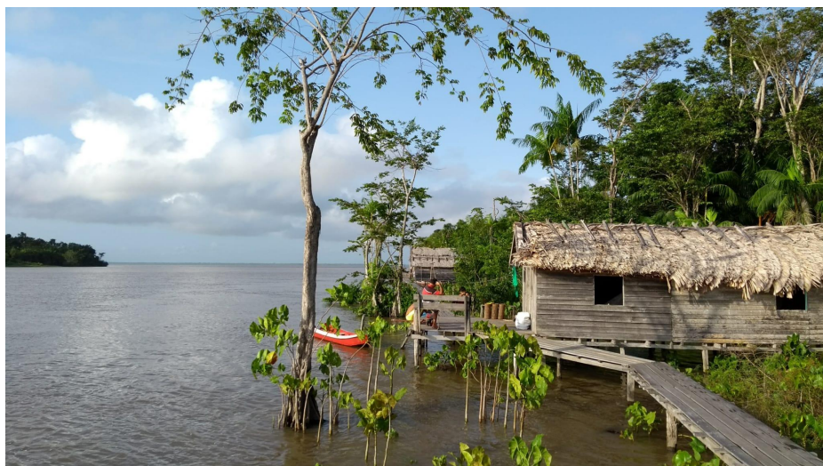
Figura 4: Ilha das Araras, Curralinho, Pará.

Os moradores desta comunidade, extrativistas em sua grande maioria, trabalhavam com a pesca do camarão, através de técnicas sustentáveis de extração deste recurso pesqueiro. A ilha possuía placas fotovoltaicas, que geram eletricidade através do uso da luz solar. Contudo, havia algum defeito nos equipamentos que distribuem a energia pela comunidade, o que acabava por fazer ocorrer picos de energia, proporcionando uma alimentação energética pouco eficiente. Esse problema era visto como o menor dos males pela comunidade, entre tantos outros que se apresentavam. Todavia, era um grande empecilho para um formador recém chegado no território e que começaria formações por diversas comunidades, que possuíam problemas de infraestrutura igual ou maiores daqueles que se apresentavam no primeiro encontro.