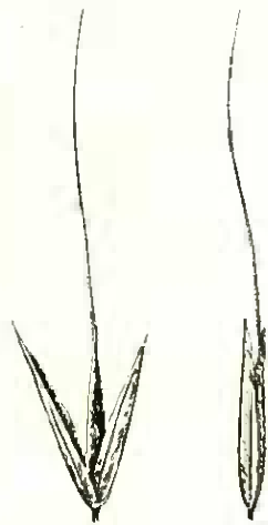
Dois aspectos da espiguetas