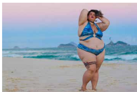
Figura 4 · Anúncio publicitário, 2007.