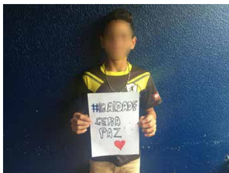
Figura 8 · Fotografias com frases de protesto. 2017