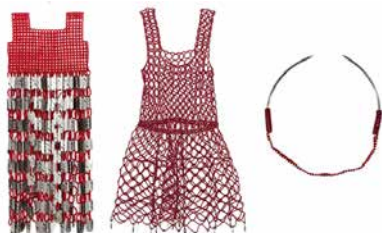
Figura 1 · Sem título (Não seremos mais vistas nem ouvidas, Bárbara Kruger, 1945