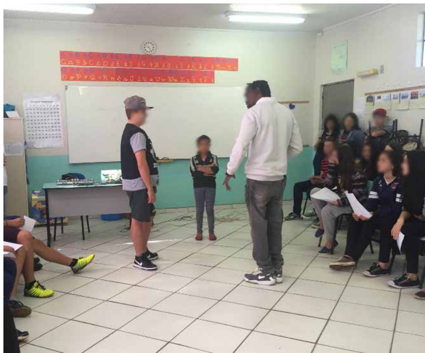
Figura 7 - Ensaios de Rap. 2017 Como prática final, os estudantes deveriam analisar as frases rascunhadas durante os ensaios de rap para utilizá-las em pequenos cartazes, para que posteriormente fosse utilizado em uma fotografia (Figura 8, Figura 9 e Figura 10).