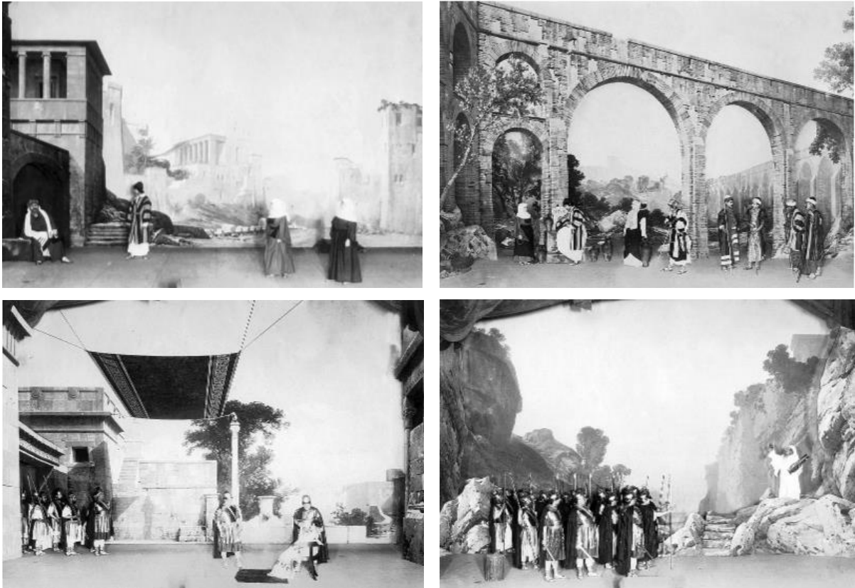
(Imagens pertencentes ao Museu Nacional do Teatro) 84

Quando se trata da adaptação dramática de uma obra pertencente a outro género literário, no entanto, esse trabalho colaborativo adquire contornos particularmente complexos, pela existência de um outro autor, que está na origem de todo o trabalho derivativo subsequente. No caso em apreço, podemos falar mesmo de um longo exercício de adaptação em cadeia: os textos bíblicos dão origem a um conto de Eça de Queirós, que dá lugar a uma adaptação dramática, a qual procura ainda elementos novos nas fontes bíblicas originais. Por outro lado, a primeira textualização da obra teatral evolui para uma segunda versão mais completa, no âmbito da qual se acrescentam versos aos atos existentes e novas cenas para os versos já compostos. Finalmente, da formulação textual surgem os ensaios, que vêm dar vida ao texto escrito, alterando-o para servir os propósitos da encenação. Neste sentido – e não obstante uma distinção fundamental entre o texto literário e o espetáculo teatral 85 – poderíamos talvez afirmar com Robson Camargo que,