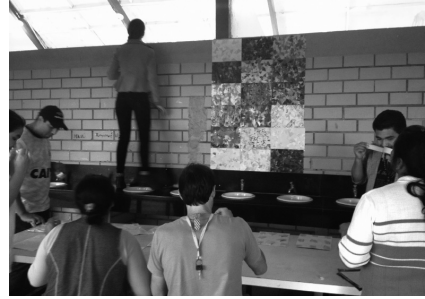
Figura 5 - Confeção de painel de cores: Educação Artística VI. Curso de Licenciatura Intercultural Indígena/Unochapecó.

Ao realizar este trabalho, o estudante consegue expandir a maneira de representar sua cultura, vai além das típicas Artes Indígenas e ao mesmo tempo, representa a dualidade de sua crença, onde duas forças assimétricas complementam a visão da cosmologia indígena. Assim: