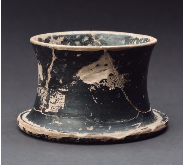
Fig. 1: Cerámica campaniense producida en la Península Itálica en el siglo I a.C.

meridionales, porque ya existía una tradición de producción de alimentos y de ánforas para su transporte en la Península Ibérica antes de la llegada de los romanos, incluso en el extremo occidente de la futura provincia de Lusitania. Por lo que conocemos de los contextos arqueológicos, podemos decir que estos artículos itálicos acompañaban a los ejércitos (no hay pruebas de un significativo comercio anterior al inicio de la conquista) y que los soldados romanos serían sus principales destinatarios. Pero las relaciones con las elites indígenas llevarán a que estos artículos pasen también a ambientes locales – no olvidemos que el proceso de asimilación cultural implicaba el consumo de nuevos