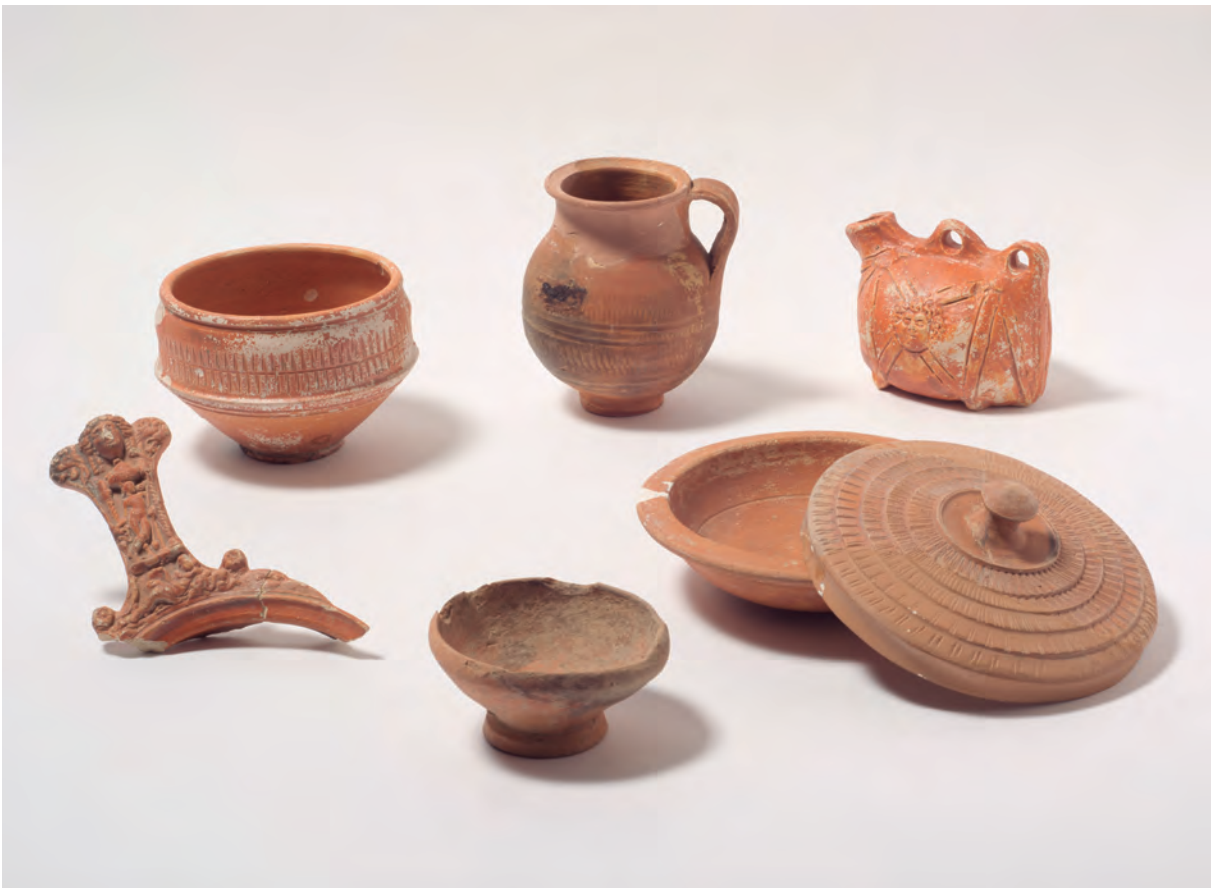
Figs. 2 y 3: Distintas producciones cerámicas de Augusta Emerita .