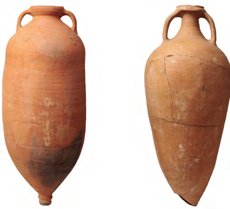
Fig. 4: Ánforas de los tipos Cardoso 91 / Keay 78 / Sado 1 y Almagro 51c producidas en el estuario del Sado para transportar las salazones de Lusitania entre los siglos III y V d.C.

siguen llegando desde el Oriente las ánforas y la vajilla fina, al mismo tiempo que del Norte de África, de Galia o de otras provincias hispanas, una prueba clara de que el sistema de intercambios seguía funcionando, aunque en creciente debilidad.